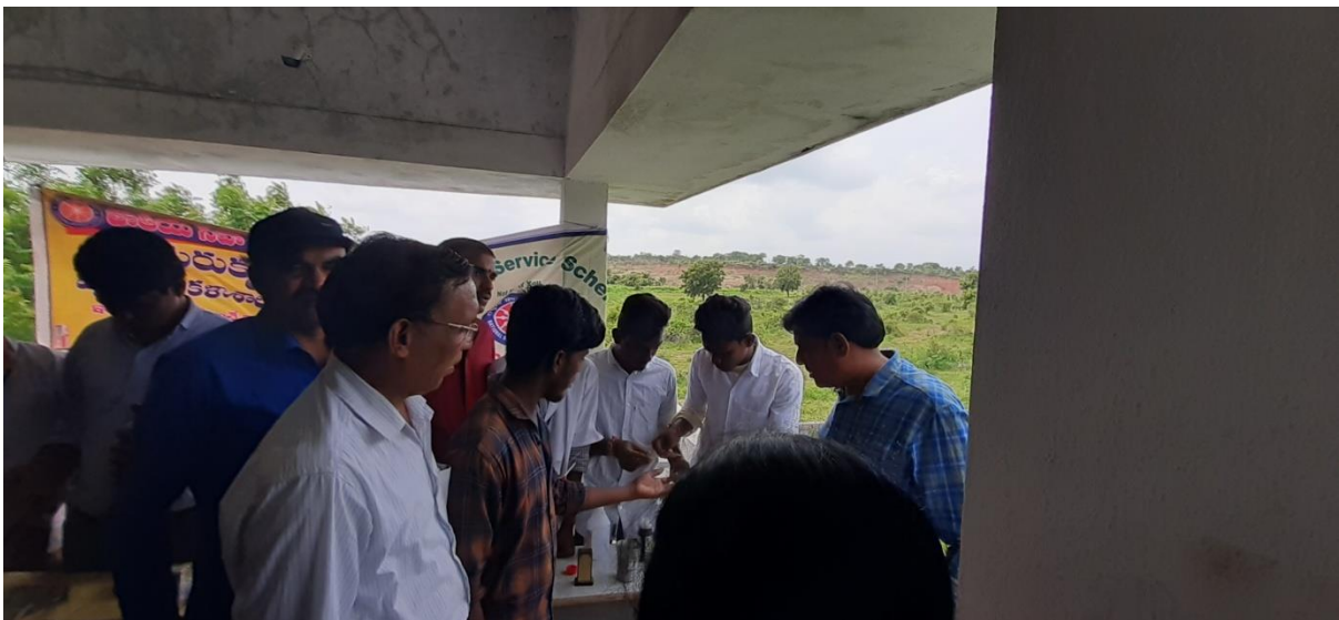
Testing haemoglobin percentage

In the part of BHAGYA we conducted haemoglobin Estimation Camp conducted on 20 th August 2019, for all (boys and girls) the students of our college with the help of GuruKrupa Hospital pathological staff.