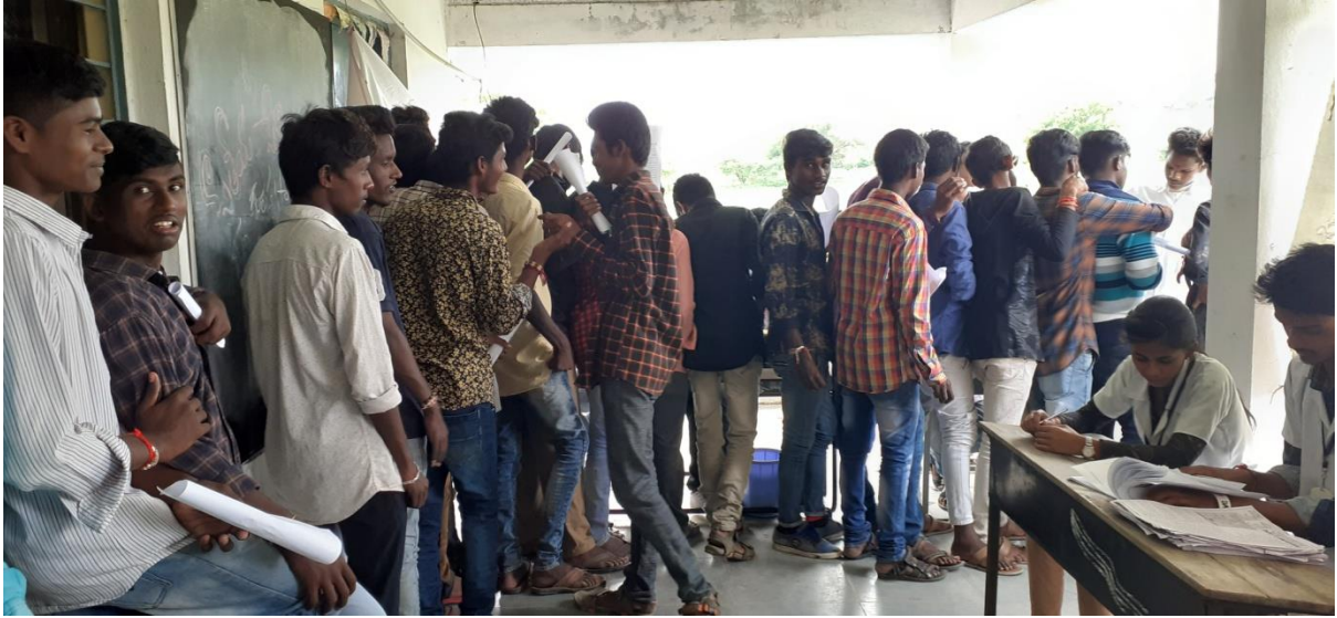
Students of GDC Bhainsa are testing their percentage of Haemoglobin