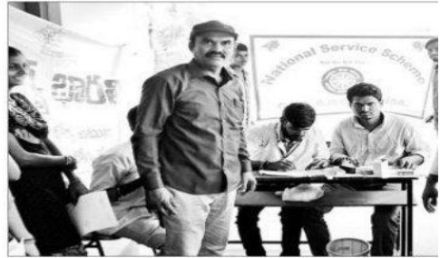
విద్యార్థులకు పరీక్షలు నిర్వహిస్తున్న...