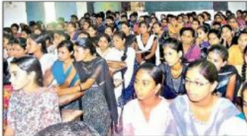
కార్యక్రమంలో పాల్గొన్న విద్యార్థులు