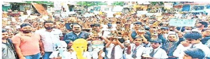
నవాబ్పేట : మట్టి వినాయక ప్రతిమలతో విద్యార్థుల ర్యాలీ

నవాబ్పేట : మట్టి వినాయకులను ప్రతిష్ఠించి కాలుష్యాన్ని నివారించాలని కోరుతూ నవాబ్పేటలోని చాణక్య పాఠశాల విద్యార్థులు శనివారం ర్యాలీ నిర్వహించారు. విద్యార్థులు మట్టితో తయారుచేసిన వినాయక ప్రతిమలను పురవీధుల్లో ప్రదర్శించారు. రసాయన పదార్థాలతో తయారుచేసిన వినాయక ప్రతిమలను ప్రతిష్ఠించడం పల్ల పర్యావరణానికి కలిగే అనర్థాలను వివరించారు. ప్లాస్టిక్ వాడకాన్ని పట్టిన పెట్టాలని కోరారు. దర్భల్లి ప్రాథమిక పాఠశాలలో విద్యార్థులు కూడా మట్టి వినాయక ప్రతిమలను తయారుచేశారు.