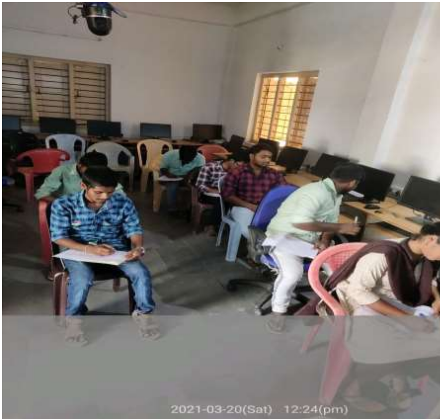
Fig: Students of the college participating in Innovative Entrepreneurship Ideas Test.