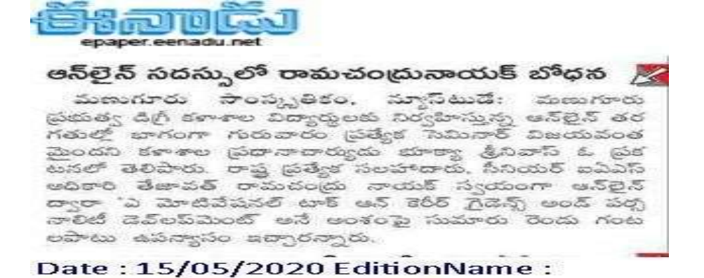
Fig 3: News Paper clippings of Webinar

TELANGANA( BHADRADRI KOTHAGUDEM ) PageNo: 01