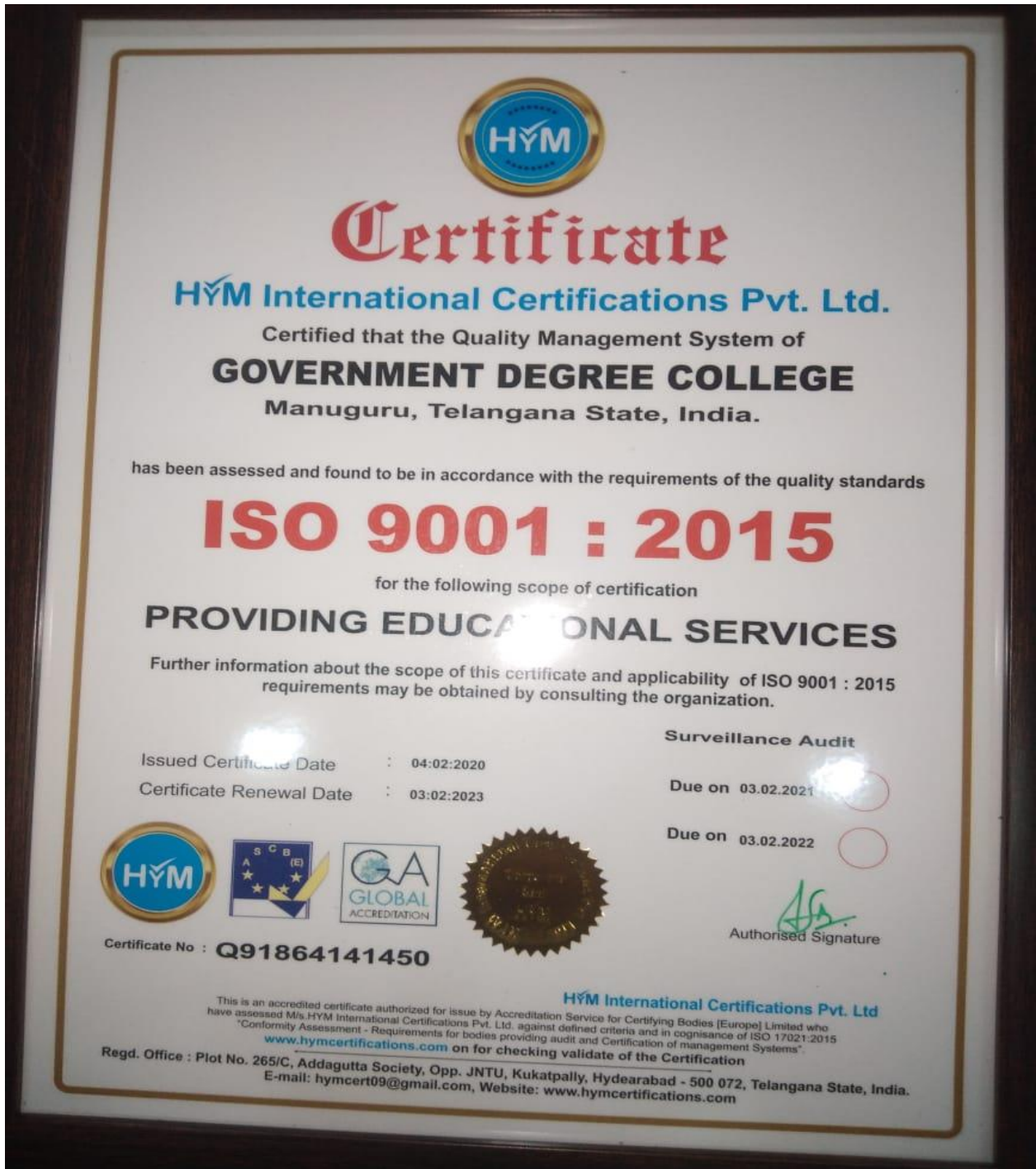
Fig: ISO Certificate Copy