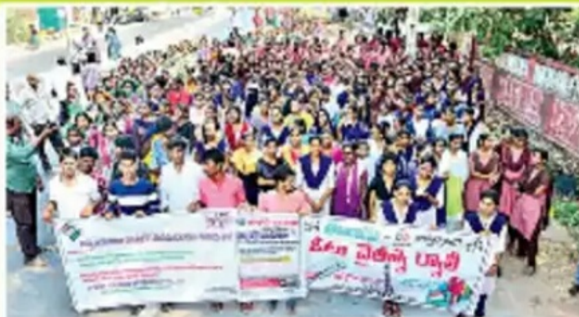
భద్రాచలం ప్రధాన రహదారిలో విద్యార్థుల ప్రదర్శన