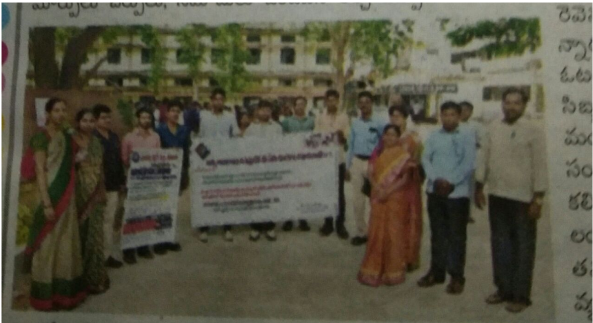
ఆంధ్రప్రదేశ్ సెంటర్: ర్యాల్ ప్రారంభిస్తున్న అధికారులు, అధ్యాపకులు