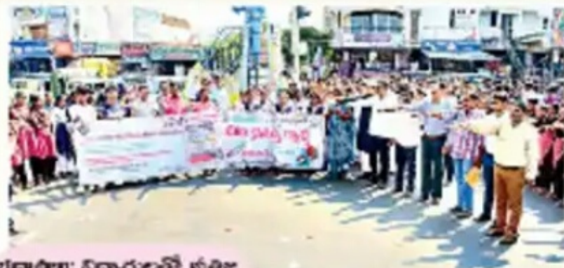
భద్రాచలం: విద్యార్థులతో ప్రతిష్ట చేయిస్తున్న ప్రభుత్వం