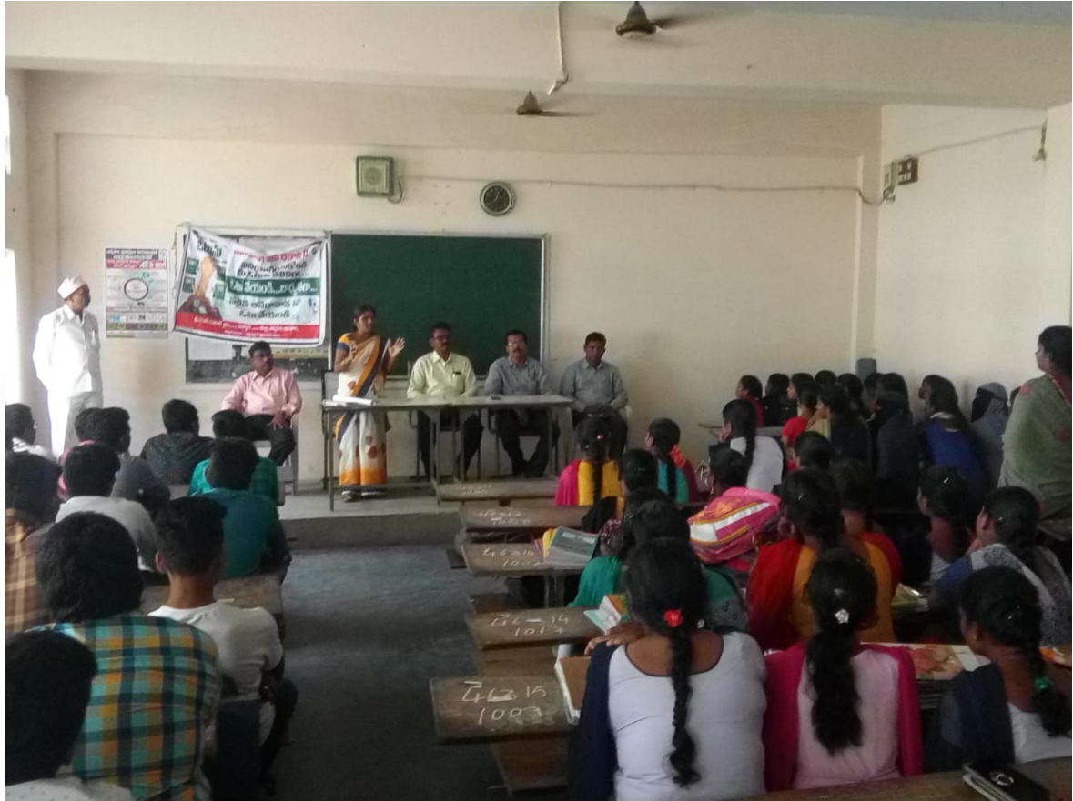
4) Constitutional Day 2018-19