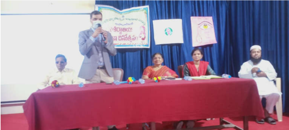
Date : 05/03/2021 EditionName : TELANGANA( MAHABUBNAGAR ) PageNo : 03