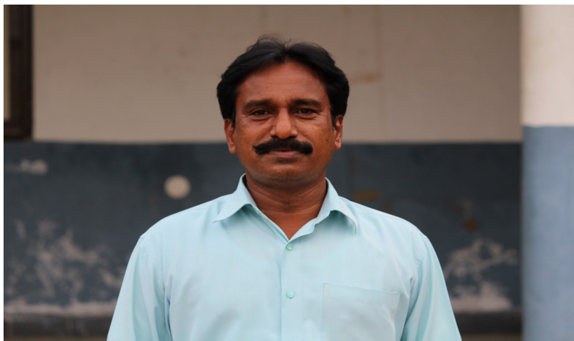
DEPARTMENT OF LIBRARY SCIENCE