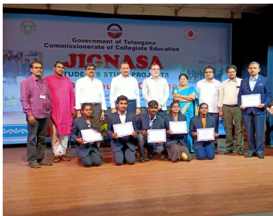
Jignasa Computer Science Project State 3 rd Prize winners 2019-20