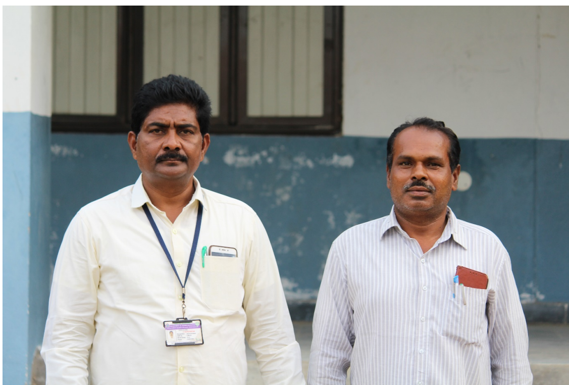
DEPARTMENT OF HISTORY