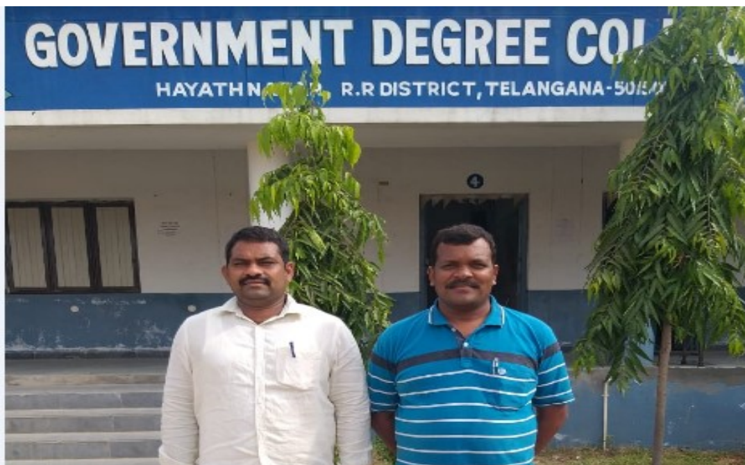
DEPARTMENT OF MATHEMATICS