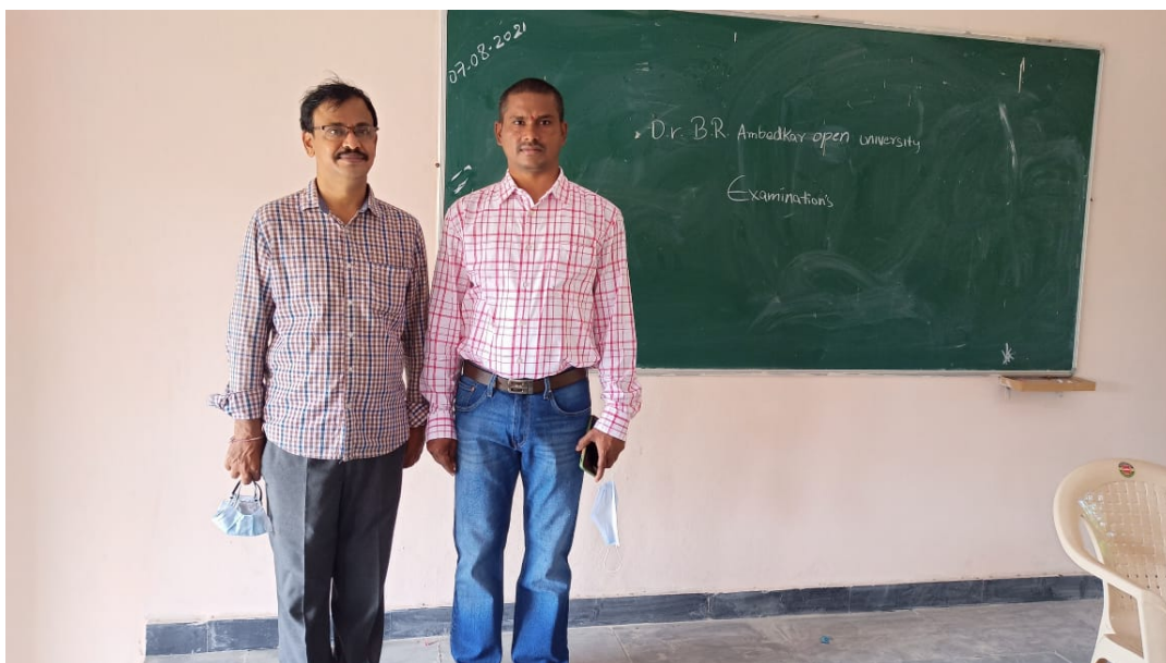
DEPARTMENT OF CHEMISTRY