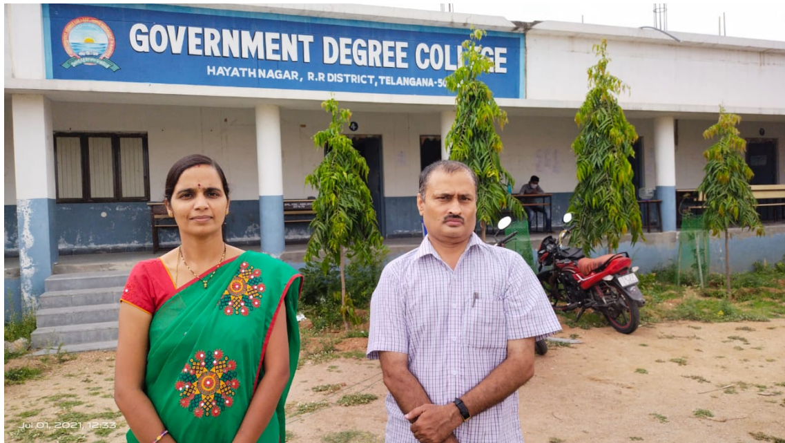
DEPARTMENT OF COMPUTER APPLICATIONS