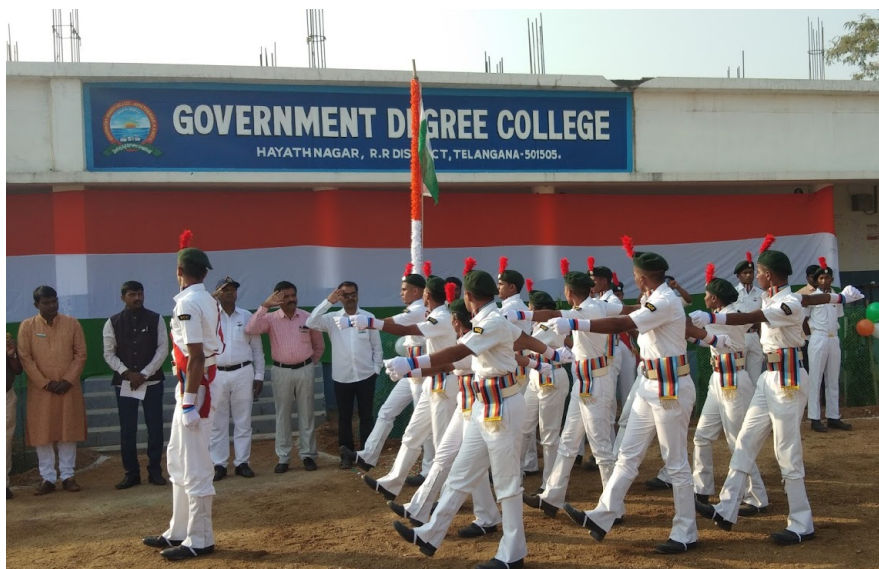
NCC Pared 26 th Jan 2020