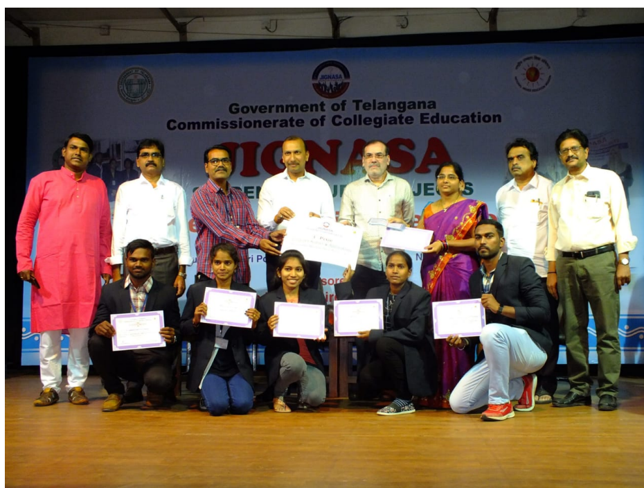
Jignasa Computer Science Project State 1 st Prize winners 2019-20