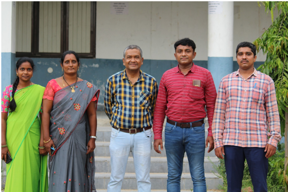
DEPARTMENT OF ENGLISH