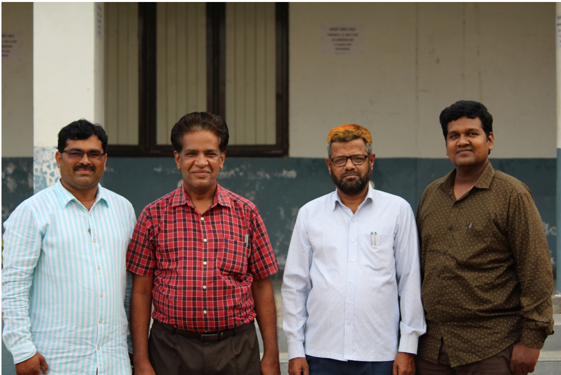
DEPARTMENT OF COMMERCE