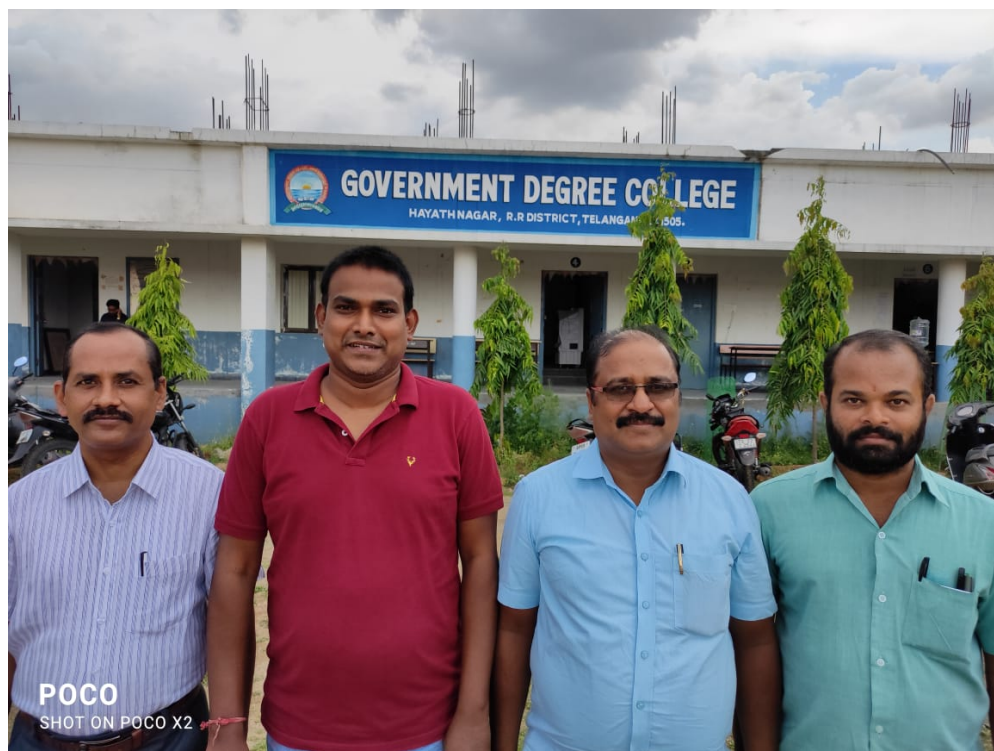
DEPARTMENT OF TELUGU