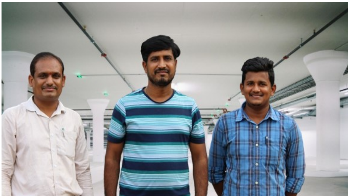
DEPARTMENT OF PHYSICS