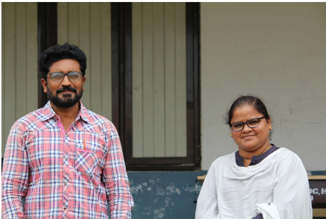
DEPARTMENT OF POLITICALSCIENCE