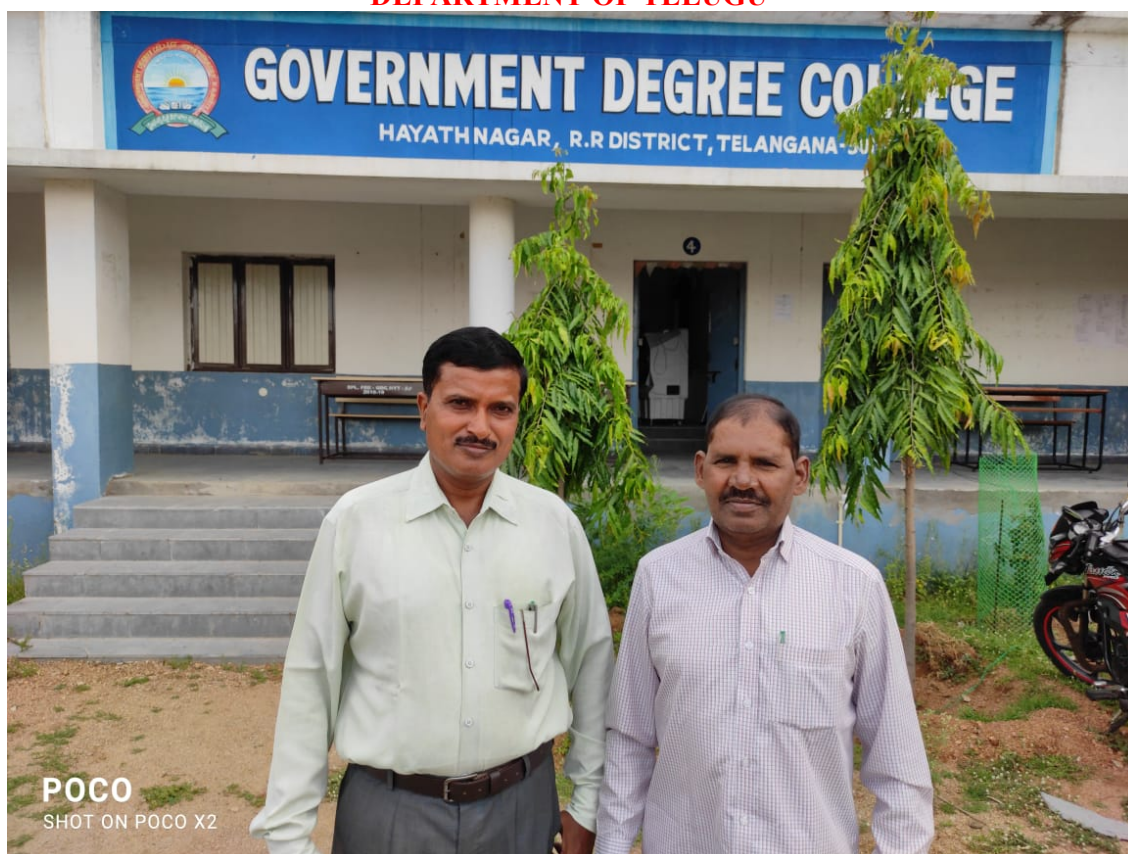
DEPARTMENT OF ECONOMICS