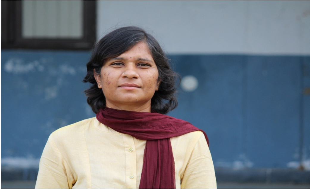
DEPARTMENT OF PUBLIC ADMINISTRATION