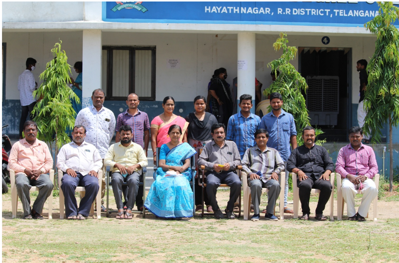
NON- TEACHING STAFF