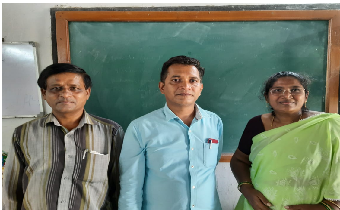
DEPARTMENT OF BOTANY