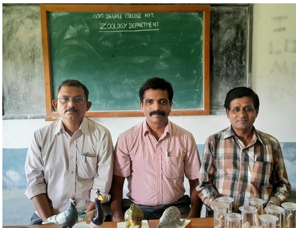
DEPARTMENT OF ZOOLOGY