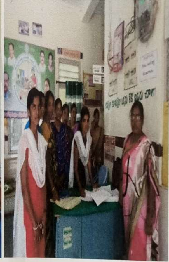
మండల వైద్యాధికారి మరియు సేబ్బందిని అడిగి వివరాలు సేకరిస్తున్న దృశ్యం