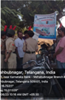
Mahbubnagar, Telangana, India Near Karnataka Bank - Mahbubnagar Branch, Mahbubnagar, Telangana 509001, India Lat 16.785888° Long 78.011877° 05/23 10:18 AM GMT +05:30