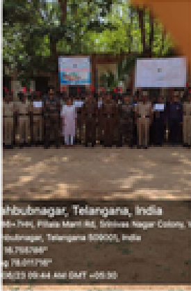
Mahbubnagar, Telangana, India Q2-46+7H4, Pitala Marni Rd, Srinivas Nagar Colony, Venkateswara Colony, Mahbubnagar, Telangana 509001, India Lat 16.78588° Long 78.01187° 05/23 09:44 AM GMT +05:30