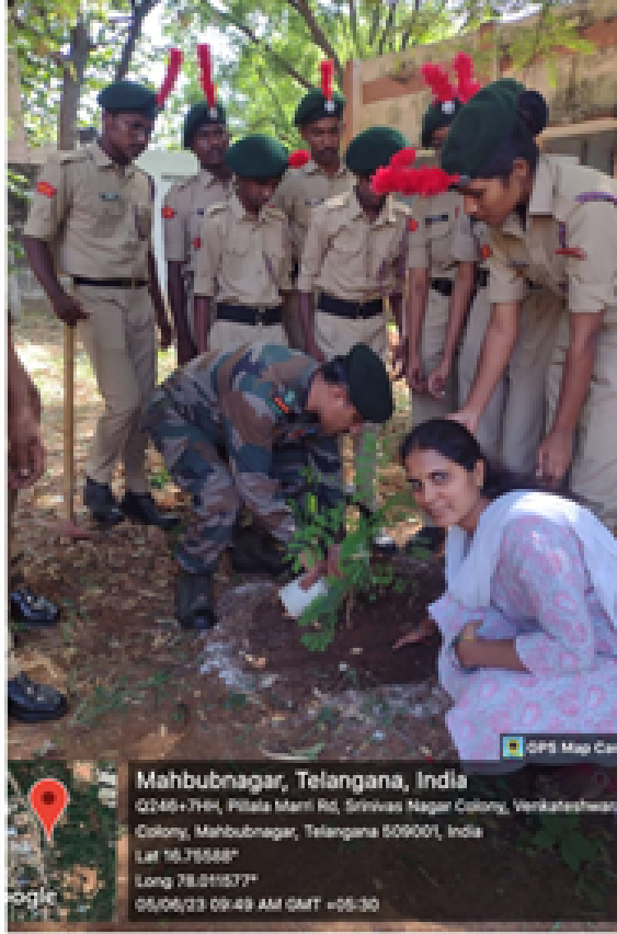
Mahbubnagar, Telangana, India Q2-46+7H4, Pitala Marni Rd, Srinivas Nagar Colony, Venkateswara Colony, Mahbubnagar, Telangana 509001, India Lat 16.78588° Long 78.01187° 05/06/23 09:48 AM GMT +05:30