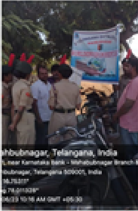
Mahbubnagar, Telangana, India Near Karnataka Bank - Mahbubnagar Branch, Mahbubnagar, Telangana 509001, India Lat 16.78588° Long 78.01187° 05/23 10:18 AM GMT +05:30