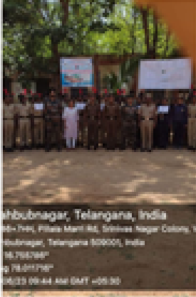
Mahbubnagar, Telangana, India Q2-46+7H4, Pitala Marni Rd, Srinivas Nagar Colony, Venkateswara Colony, Mahbubnagar, Telangana 509001, India Lat 16.785888° Long 78.011877° 05/23 09:44 AM GMT +05:30