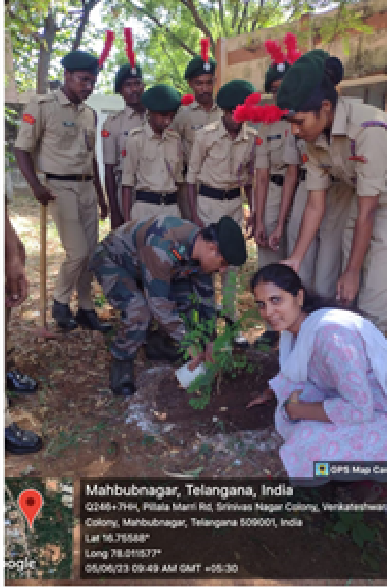
Mahbubnagar, Telangana, India Q2-46+7H4, Pitala Marni Rd, Srinivas Nagar Colony, Venkateswara Colony, Mahbubnagar, Telangana 509001, India Lat 16.785888° Long 78.011877° 05/06/23 09:48 AM GMT +05:30