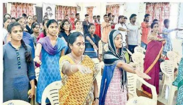
విద్యార్థులచే ఆరోగ్య ప్రతిజ్ఞ చేయిస్తున్న దృశ్యం