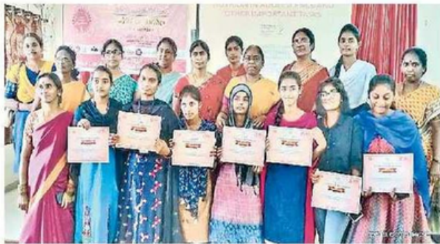
విద్యార్థినులకు అందించిన ద్రువీకరణపత్రాలతో అతిథులు, అధ్యాపకులు

అర్బన్ కలెక్టరేట్, న్యూస్టుడే : ఎదిగే పిల్లలకు పోషకాహారమిచ్చి ఆరోగ్యవంతమైన సమాజాన్ని అందించడమే లక్ష్యమని జిల్లా సంక్షేమాధికారి సభిత అన్నారు. గురువారం హన్మకొండలోని కాక తీయ డిగ్రీ కళాశాలలో ఐసీడీఎస్ అధ్యక్షులలో పోషణ అభియాన్ మాసోత్సవాల్లో భాగంగా జిల్లా స్ట్రాయి సెమినార్ నిర్వహించారు. ఈ సందర్భంగా సంక్షేమాధికారి సభిత