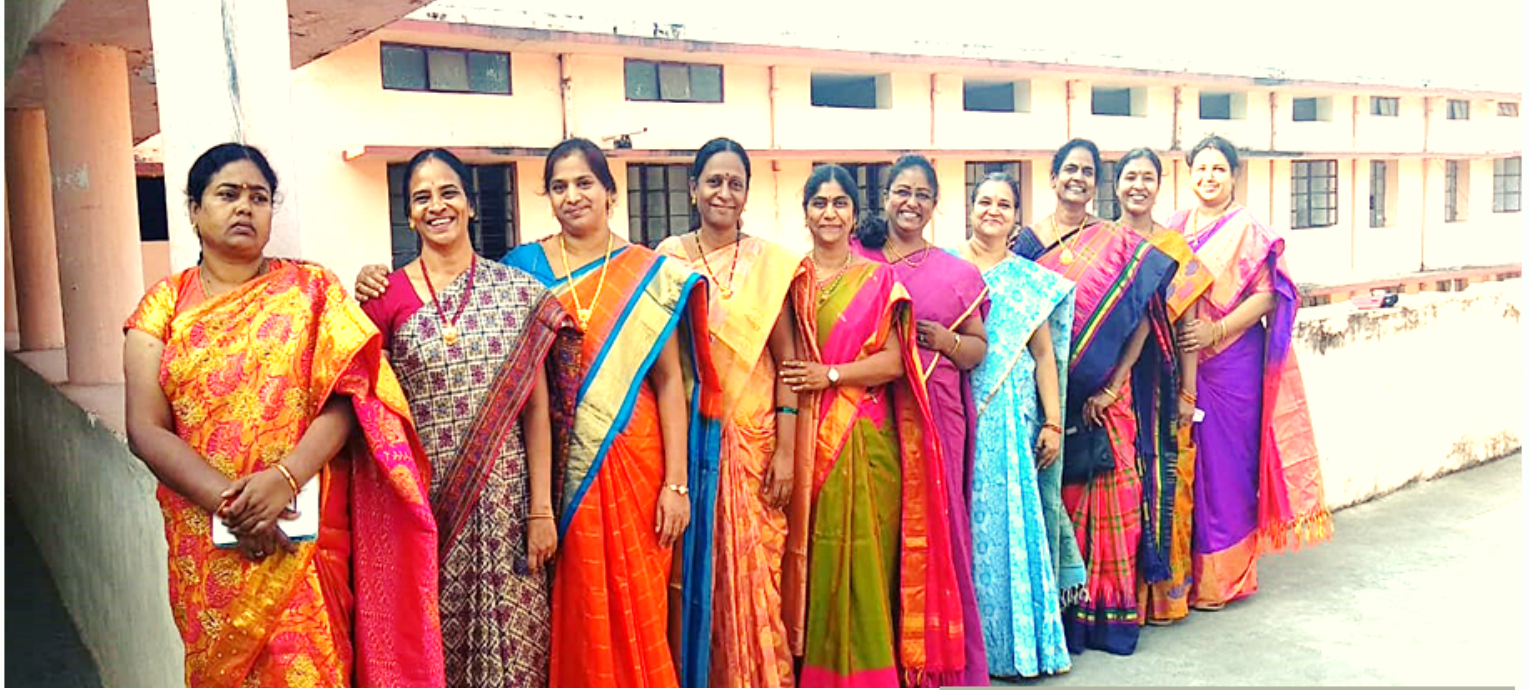
Women Empowerment Cell, KGC Hanumakonda