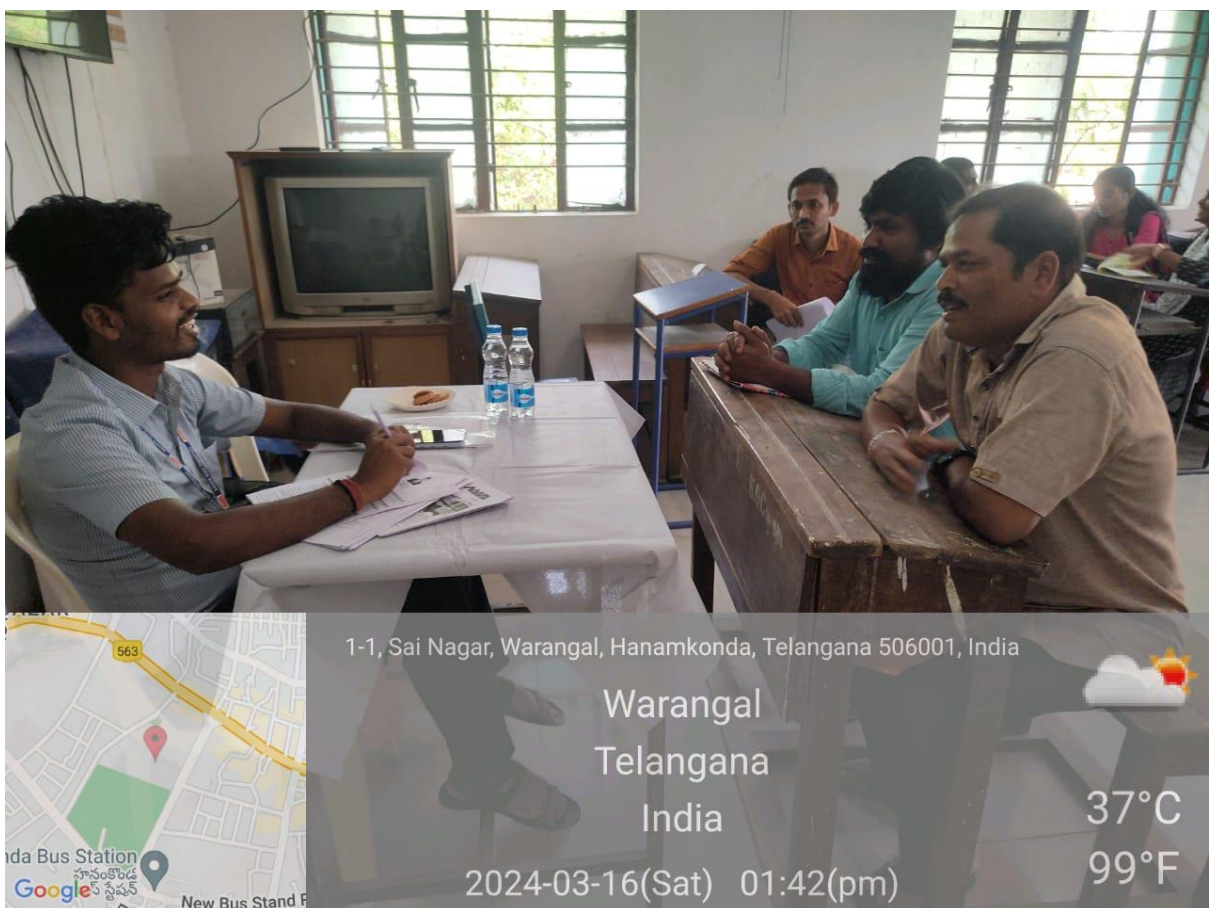
Job Drive : aspirants registration and parents counselling