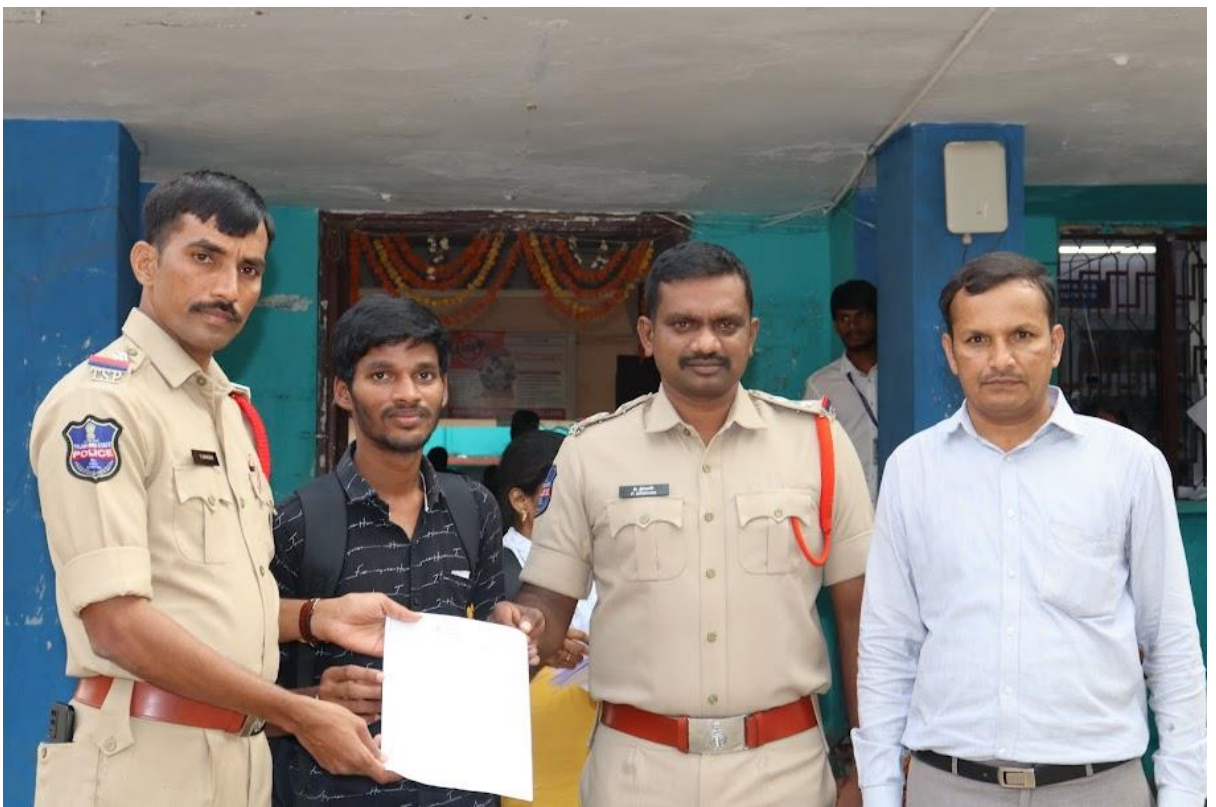
Job Offer letter distribution by police officials and placement officer