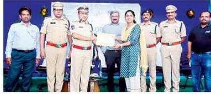
యువతికి నియామక పత్రం అందజేస్తున్న సీపీ