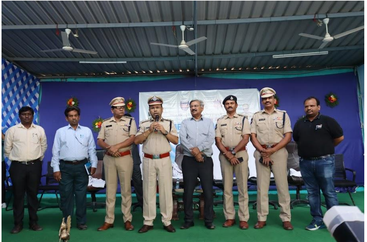
Job Drive inaugural addressing by Sri Ambar Kishore Jha, IPS ,Commissioner of Police, Warangal police Commissionerate