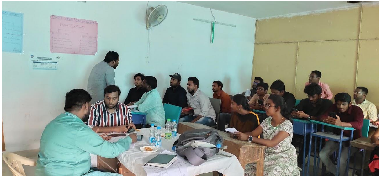
Interviews and assessing sessions