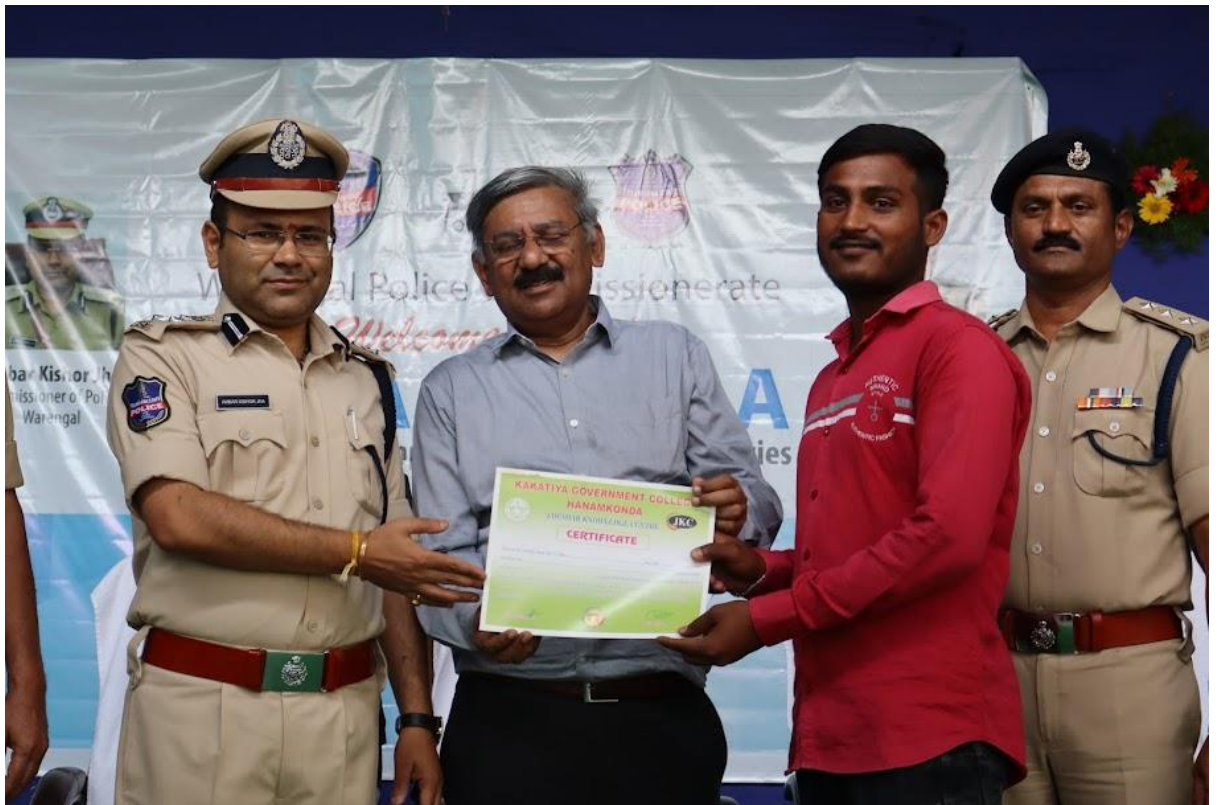
Job Offer letter distribution by honorable CP and TMI group chairman