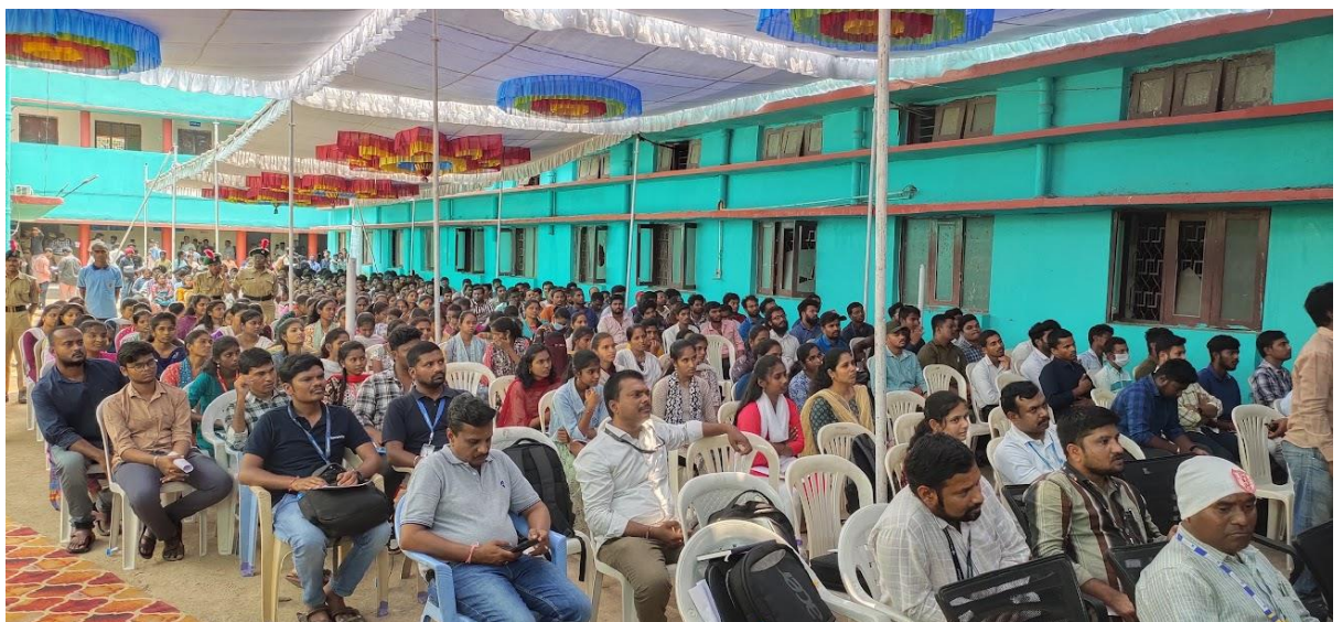
Job Drive gathering