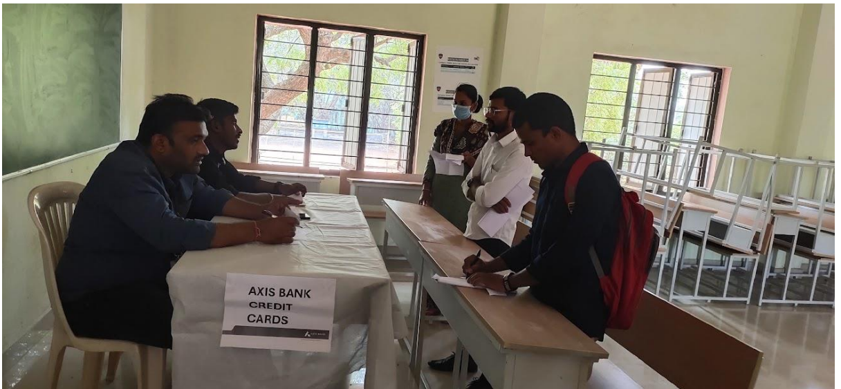
Interviews and assessing sessions