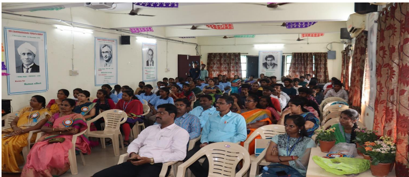
Gathering on day 1 & day 2