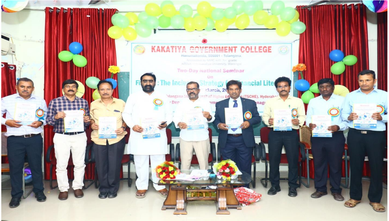
Souvenir release by the delegates at inaugural session