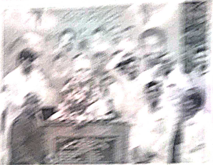
Caption text located below the second photograph, providing context for the scene depicted.

Vertical column of handwritten text on the left side of the page, below the first photograph.