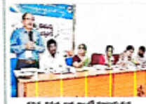
అంబుల కమ్యూనిటీ కార్యకర్తల సమావేశం

అంబుల కమ్యూనిటీ కార్యకర్తల సమావేశం. ఎంపీ కె.వి.ఎస్. రమణారావు మాట్లాడుతున్నారు.