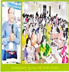
వార్తాపత్రిక ప్రతినిధి కవిత్వ విమర్శ సమావేశం

వార్తాపత్రిక ప్రతినిధి కవిత్వ విమర్శ సమావేశం మొదలు పెట్టినది. కవిత్వ విమర్శ సమావేశం మొదలు పెట్టినది.