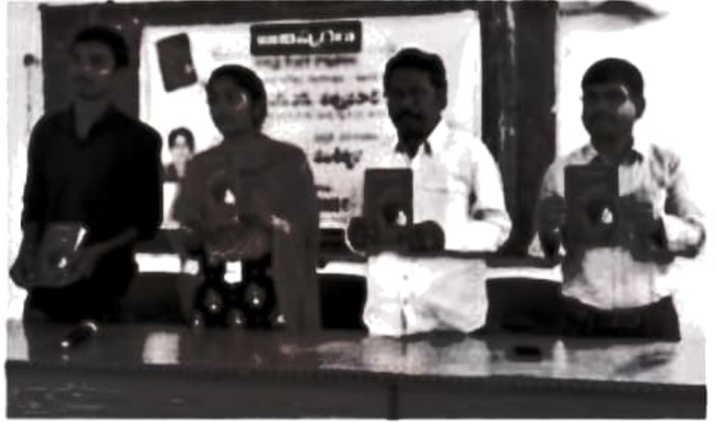
పుస్తకాన్ని ఆవిష్కరిస్తున్న అధ్యాపకులు

ఖమ్మం ఎడ్యుకేషన్, ఫిబ్రవరి 24: నగరంలోని ఎస్ఆర్ ఆండ్ బీజీఎస్ఆర్ ప్రభుత్వ డిగ్రీ కళాశాల తెలుగు విభాగం ఆధ్వర్యంలో ఇటీవల వినూత్నంగా నిర్వహిస్తున్న 'ఆవిష్కరణ - విద్యార్థి కేంద్రక' కార్యక్రమంలో భాగంగా