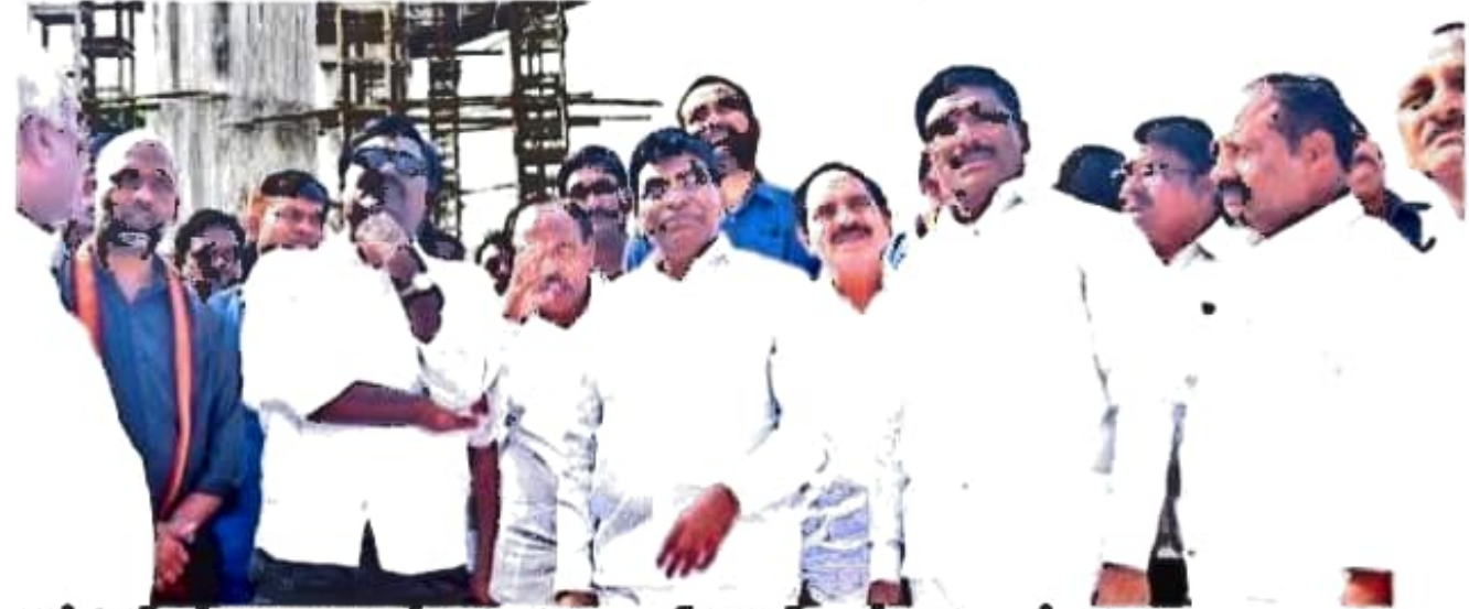
రైల్వే ఓవర్ బ్రిడ్జి పనులను పరిశీలిస్తున్న మంత్రి అజయ్ కుమార్, ఎంపీ నామా నాగేశ్వరరావు

ఖమ్మం నగరంలోని ధంసలాపురం రైల్వే ఓవర్ బ్రిడ్జి పనులను వేగవంతం చేసి త్వరగా పూర్తి చేయాలని