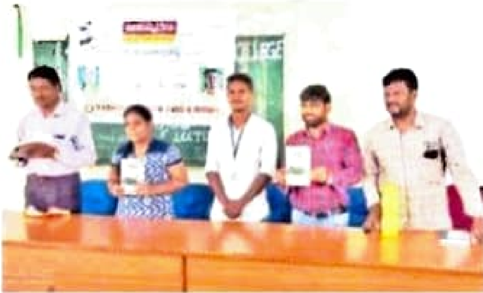
పుస్తకాన్ని ఆవిష్కరిస్తున్న అధ్యాపకులు