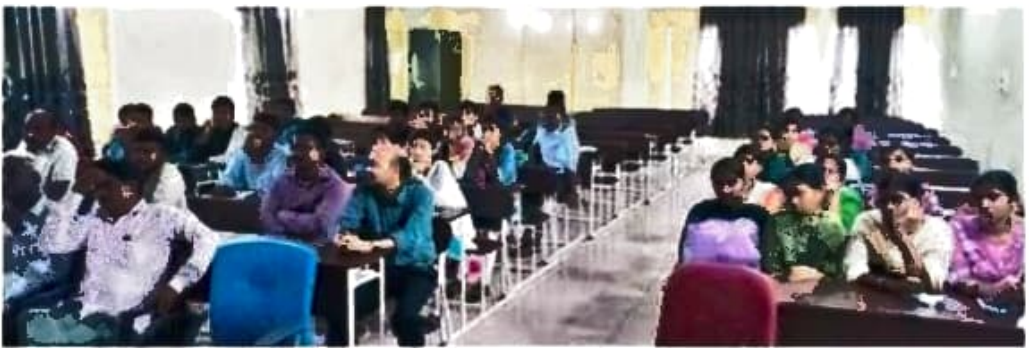
కార్యక్రమానికి హాజరైన సాహితీవేత్తలు, విద్యార్థులు