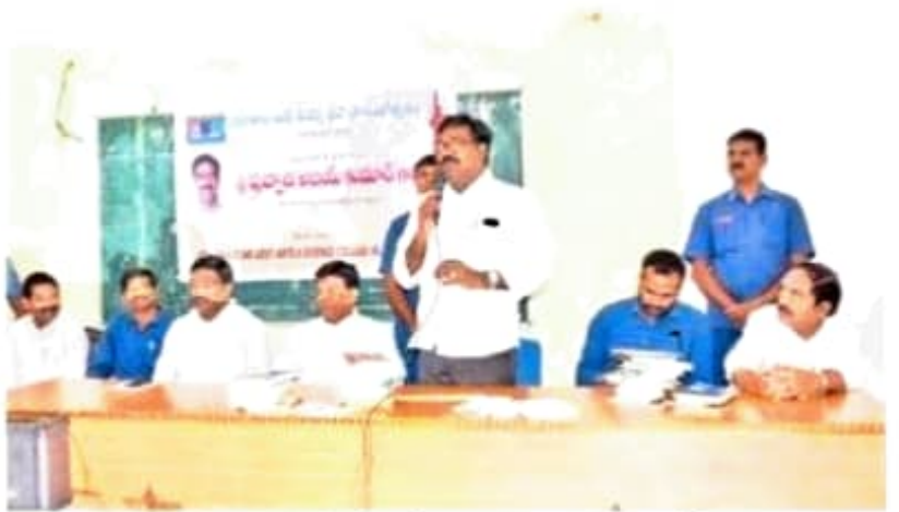
మాట్లాడుతున్న మంత్రి పువ్వాడ అజయ్