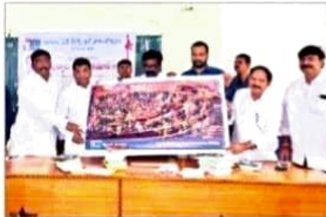
పోస్టర్ను ఆవిష్కరిస్తున్న దృశ్యం