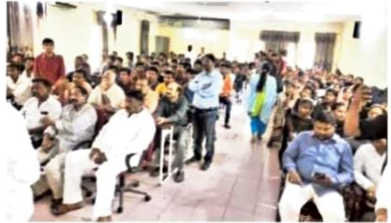
పోస్టర్ను ఆవిష్కరిస్తున్న మంత్రి అజయ్, ఎంపీ నామా, ఎమ్మెల్సీ బాలసాని, తదితరులు, కార్యక్రమానికి హాజరైన అధ్యాపకులు, విద్యార్థులు