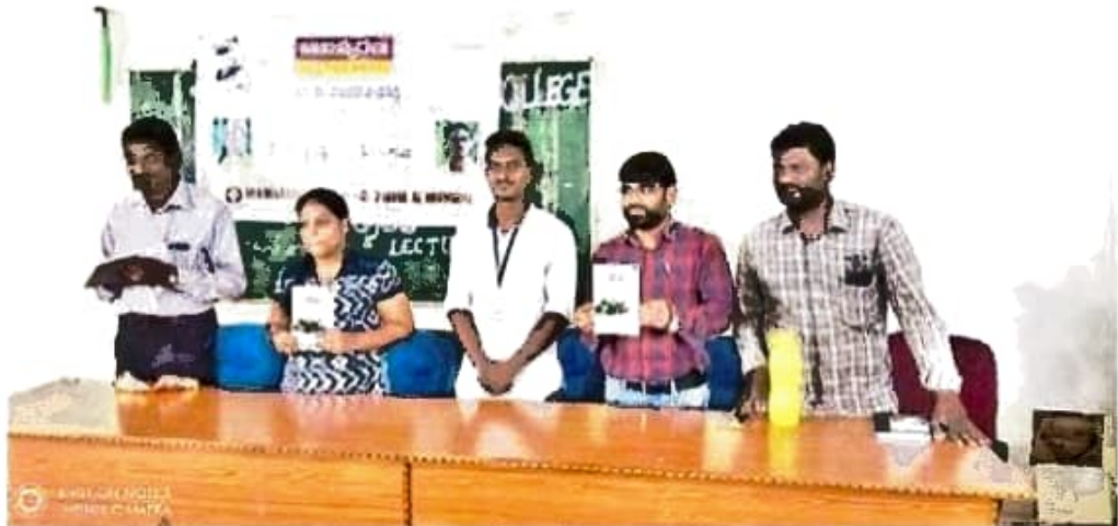
పుస్తకాన్ని ఆవిష్కరిస్తున్న విద్యార్థులు

నించడం రివాజే. కానీ ఈ కళాశాలలో నిర్వహించే సాహిత్య కార్యక్రమాలకు విద్యార్థులే అన్ని పాత్రలు పోషిస్తూ వర్తమాన సాహిత్య బాటలు వేసుకుంటుండటం విశేషం.. కళాశాలలో ఆయా సిలబస్లకు సంబంధించిన పాఠాలు బోధించటం వరకే పరిమితం అవుతుండగా ఈ కళాశాల విద్యార్థులకు సాహిత్య సాంస్కృతిక కార్యక్రమాల రూపకల్పన నాయకత్వ లక్షణాలను పెంపొందిస్తోంది. పరిశీలన, పరిశోధన, విశ్లేషణ, ప్రసంగ కళల్లో తర్ఫీదునిస్తోంది. ఏదైనా పుస్తకాన్ని ఎంచుకొని దానిని తమ కళాశాలలో ప్రత్యేక ఆవిష్కరణ, విశ్లేషణ కార్యక్రమం ఏర్పాటు చేస్తారు. పుస్తకాన్ని ఎంచుకునేందుకు, ఆవిష్కరణకు తమలోనే ఒకరిని ముఖ్యఅతిథిగా ఎంచుకోవటం, ఆ పుస్తకాన్ని సమీక్షించేందుకు మరొక వక్తను తమ నుండే ఎనుకుంటారు. పుస్తకం, వక్తలు, అతిథుల ఎంపిక ఆనంతరం ఇతర కార్యక్రమాల మాదిరిగానే ఆహ్వాన పత్రాల ముద్రించి తోటి విద్యార్థులకు అధ్యాపకులకు పంపుతారు. నిర్ణీత కార్యక్రమం రోజున కళాశాల ప్రెస్సిఫల్ అతిథిగా తెలుగు విభాగం, తదితర అధ్యాపకుల సమక్షంలో కార్యక్రమం కొనసాగిస్తారు. కోర్సులో భాగంగా సాహిత్య కార్యక్రమాలు చేపడుతున్న విద్యార్థులను సాహితీ ప్రముఖులు అభినందిస్తున్నారు.