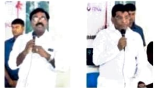
మాట్లాడుతున్న మంత్రి, ఎంపీ

విద్యార్థులు బాధ్యతగల పౌరులుగా ఎదగాలని ఎంపీ నామా నాగేశ్వర రావు ఆకాంక్షించారు. డిగ్రీ కళాశాల అధ్యాపకులు తమ మేధాశక్తిని విద్యార్థుల పురో గతికి వినియో గిస్తుండటం అభినందనీయమన్నారు. విద్యార్థులు ప్రపంచ చరిత్రను తెలుసుకోవ టంతోపాటు సామాజిక అవగాహన పెంపొందించుకోవాలని, పార్లమెంట్ గ్రంథాలయంలో 17లక్షల పుస్తకాలున్నాయని ఆయన ఈ సందర్భంగా వివరించారు. ఆసక్తి ఉన్న విద్యార్థులను పార్లమెంట్లోని గ్రంథాలయ సందర్శనకు తీసుకెళ్తానన్నారు.