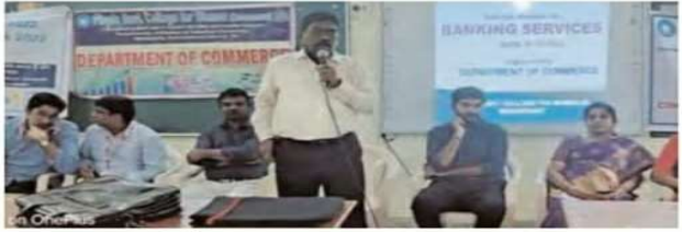
బ్యాంకింగ్ సేవలపై అవగాహన కల్పిస్తున్న సిబ్బంది