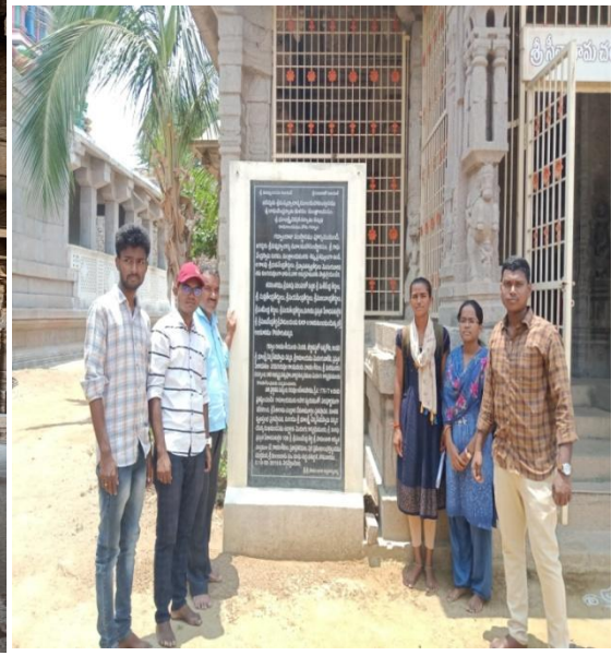
గద్దాల సంస్థానాధీశులు నిర్మించినటువంటి చెన్నకేశ్వర ఆలయ శాసనం.