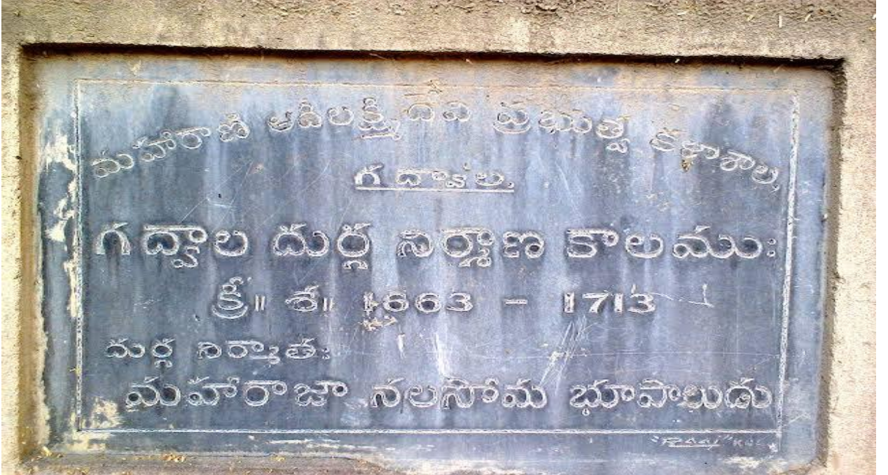
Gadwal samsthanam Inscription

గద్వాల కోట:- గద్వాల సంస్థానాధీశుడు అయిన పెద్ద సోమ భూపాలుడు క్రీస్తుశకం 1663 నుండి 1712 మధ్యలో పరిపాలించడం జరిగింది. ఈ మధ్య కాలంలోనే గద్వాల కోట ను నిర్మించడం జరిగింది. ప్రస్తుతం గద్వాలకోట లో శ్రీ లక్ష్మీ చెన్నకేశవ ఆలయం ,రామాలయం ,లక్ష్మీ దేవి ఆలయం తో పాటుగా "మహారాణి ఆదిలక్ష్మి దేవమ్మ" డిగ్రీ మరియు పిజీ కళాశాల ఉన్నాయి. చక్కని శిల్ప నిర్మాణంతో ఈ ఆలయలు చూపరులను ఆకట్టుకుంటుంది.శిథిలావస్థలో ఉన్న కోట బురుజుల మధ్య ఈ చారిత్రక ఆలయం పట్టణంలో వివిధ ఆలయాలను చూడవచ్చు.