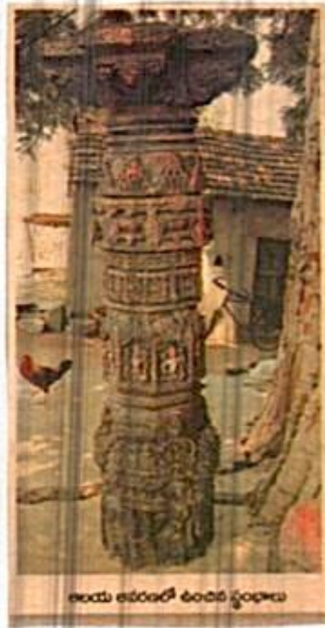
ಕಾಯಿ ಅರಸರಲ್ಲಿ ಕಂಡಿರುವ ಸ್ತಂಭಗಳು