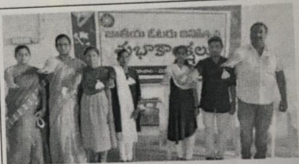
ప్రతిజ్ఞ చేస్తున్న అధ్యాపకులు, విద్యార్థులు