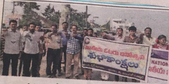
పరకాలలో ప్రతిజ్ఞ చేస్తున్న విద్యార్థులు