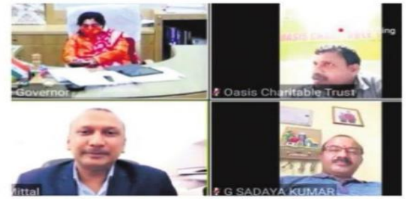
వీడియో కాన్ఫరెన్స్లో పాల్గొన్న గవర్నర్, అధ్యక్షులు