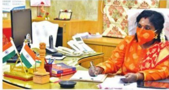
అంతర్జాతీయ పద్ధతల సమీక్షలో ఆదివారం ముఖ్యఅతిథిగా పాల్గొని మాట్లాడుతున్న గవర్నర్ తమిళనాడు