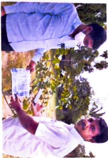
మొక్క క్యూఆర్ కోడ్ను స్కాన్ చేస్తున్న ప్రిన్సిపాల్