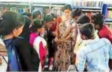
కళాశాలలోని పీఠంలో లాఠీపత్తలను పరిశోధిస్తున్న విద్యార్థులు