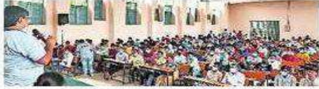
అపగాహన కల్పిస్తున్న సంస్థ ప్రతినిధి

సిద్దిపేట టౌన్: సిద్దిపేట ప్రభుత్వ డిగ్రీ-పేజీ కళాశాలలో మంగళవారం నిర్వహించిన మెగా ఉద్యోగ మేళాకు మంచి స్పందన లభించింది. డీన్ దయాళ్ ఉపాధ్యాయ గ్రామీణ కౌశల్ యోజన