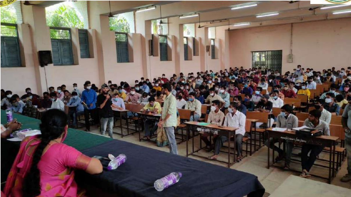
Students asking doubts