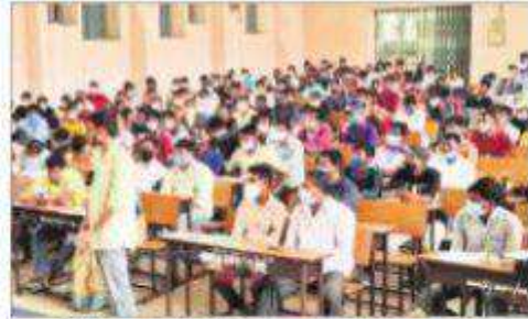
జాబ్ మేళాకు హాజరైన అభ్యర్థులు