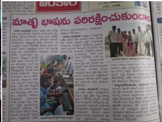
Orientation program on Telugu Typing Script on 28 February 2019