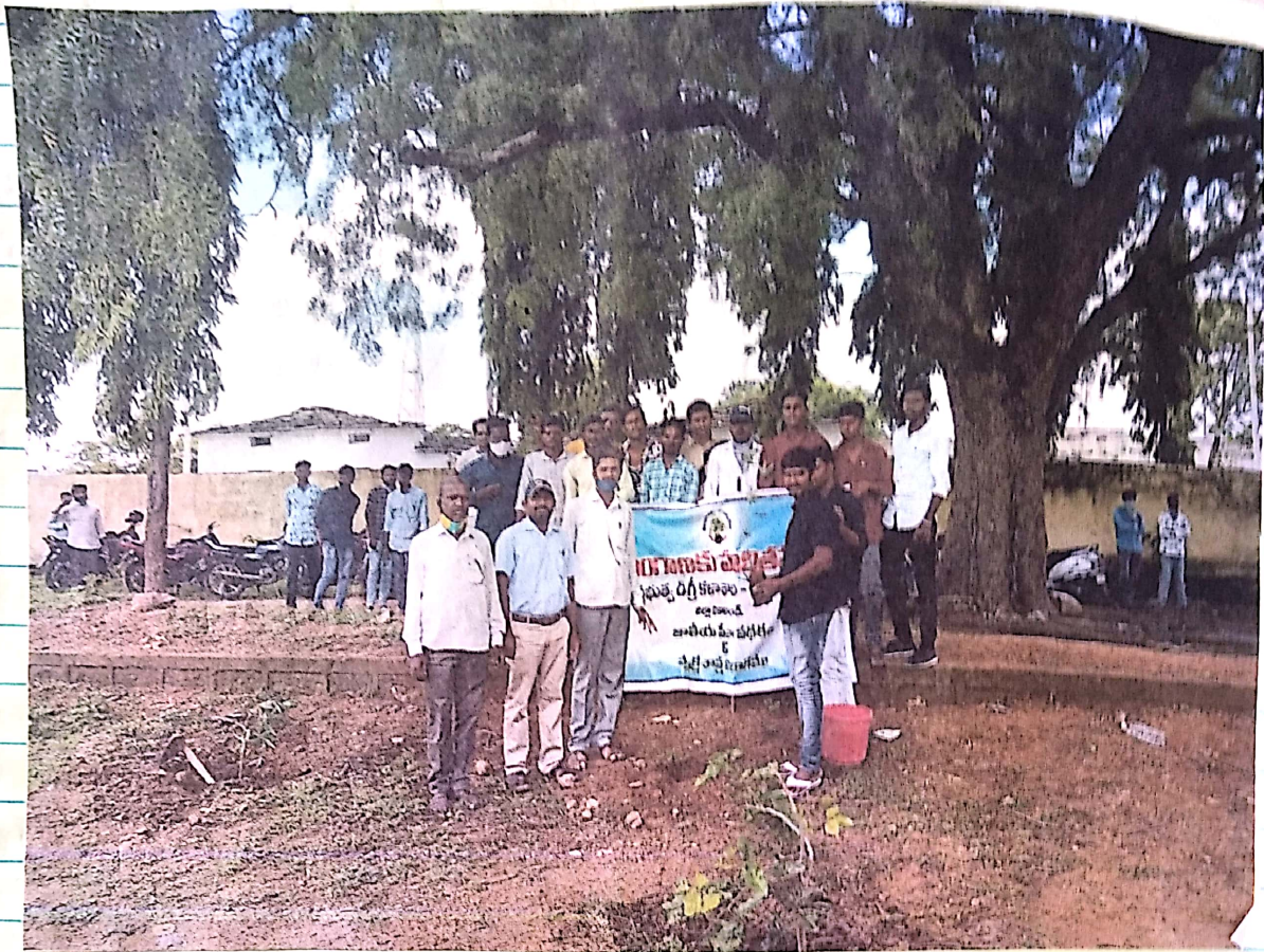
ಕೃಷಾಪಾಲ ಆರೋಗ್ಯ ಕಾರ್ಯಕ್ರಮ ನಡವಿಸಿ ಅಧ್ಯಕ್ಷರು