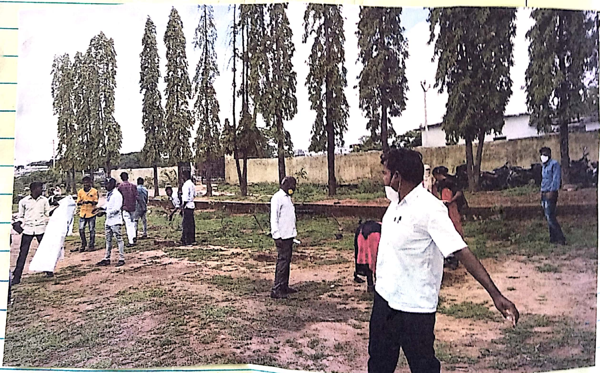
ಕೃಷಾಪಾಲ ಆರೋಗ್ಯ ಕಾರ್ಯಕ್ರಮ ನಡವಿಸಿ MRS ವಾಲಂದರೇ