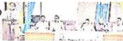
వినియోగదారుల రక్షణ దినం ప్రారంభం

వినియోగదారుల హక్కులపై అవగాహన ఉండాలి. వినియోగదారుల హక్కులపై అవగాహన ఉండాలి. వినియోగదారుల హక్కులపై అవగాహన ఉండాలి.