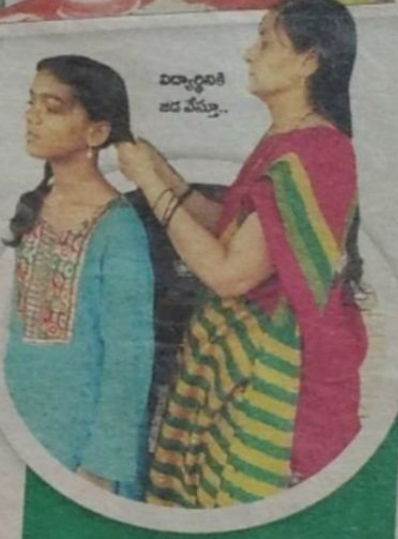
విద్యార్థిని జడ చేస్తున్న...