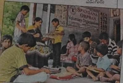
పిల్లలతో హోంవర్క్ చేయిస్తున్న దృశ్యం

తల్లిదండ్రులు మృతి చెంది ఆనాదలుగా ఉన్న పిల్లలను వారి సమీప బంధువులు కాని, గ్రామస్థులు కాని సమాచారం అందిస్తే పూర్తి వివరాలు సేకరించి వారిని ఆశ్రమంలో చేర్చుకుంటారు. దీంతో పాటు పలు పత్రకల్లో ఆనాద పిల్లలపై వచ్చిన కడనాలను ఆధారంగా పేసుకొని వారిని ఆశ్రమంలో చేర్చుకొని ఆశ్రయం కల్పిస్తున్నారు. ఒక ప్రాంతమని కాకుండా ఆనాద పిల్లలు ఏళ్ళిడ ఉన్నా సరే ఆశ్రమంలో చేర్చుకునేందుకు సిద్ధంగా ఉంటారు. ఏ ప్రాంతం వారైనా తల్లిదండ్రులు మృతి చెంది ఆనాదలుగా మారిన పిల్లలను గుర్తించి పరీక్షణ నింబరు. 9852081292కు సమాచారం అందిస్తే స్వయంగా పిల్లలను తీసుకొని ఆశ్రమంలో చేర్చుకుంటారు.