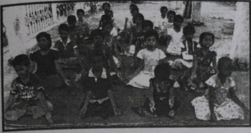
ఆశ్రమములోని చిన్నారులు ప్రతిరోజు ధ్యానం చేస్తున్న దృశ్యం