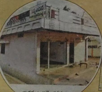
ఆశ్రమం అద్దె భవనం

విద్యార్థులకు కుట్టు అర్చికలపై శిక్షణ ఇప్పిస్తూ ఆశ్రమ నిర్వాహకురాలు విధి చిన్న చూపు చూడటంతో ఎంతో మంది పిల్లలు తమ తల్లిదండ్రులను కోల్పోతూ అనాథలుగా మారుతున్నారు. అటువంటి వారిని అక్కడనే చేర్చుకుంటూ అందగా నిలుస్తుంది స్పందన అనాథ స్వచ్ఛంద సేవా సంస్థ. అమ్మానాన్నలు లేని అభాగ్యులను అక్కడనే చేర్చుకుని వారిని తీర్చిదిద్దుతున్నారు. అనాథలకు అందగా నిలవాలనే ఆశయంతో కరీంనగర్ జిల్లా జమ్మికుంట మండలం కొత్తవల్లిలో స్పందన సేవా సంస్థను నిలకొల్పారు. చదువుకొనే రోజుల్లోనే అనాథలకు తన వంతు సహాయం అందించాలనే ఆలోచన బలంగా ఉండటం, వివాహం తర్వాత కూడా తన భార్య నుంచి సంపూర్ణ మద్దతు లభించడంతో 30 మంది అనాథ పిల్లల ఆలనా పాలన చూస్తున్న ఆదర్శ దంపతులపై న్యూస్టుడే ప్రత్యేక కథనం.