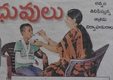
అన్నం తినిపిస్తున్న ఆశ్రమ నిర్వాహకురాలు