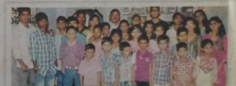
స్పందన అనాథ ఆశ్రమంలోని విద్యార్థులు