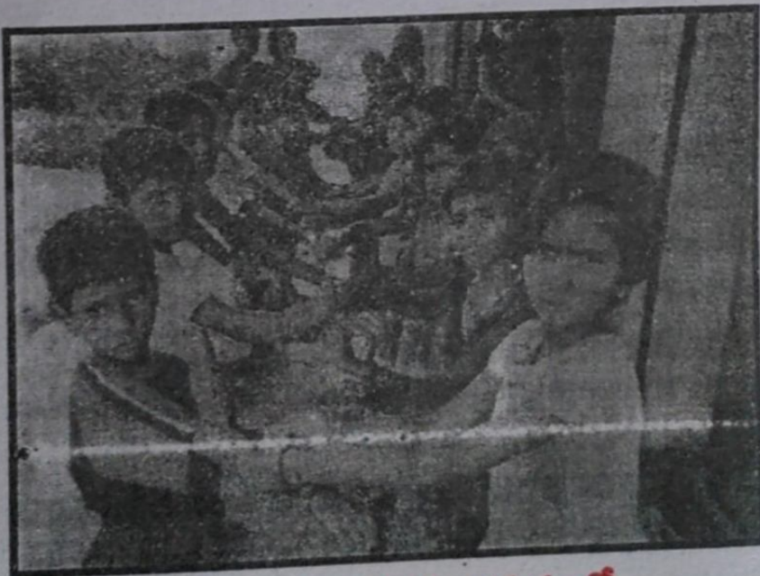
కొత్తపల్లి-జమ్మికుంట ఆశ్రమములో గాణీలు కడుతున్న చిన్నారులు