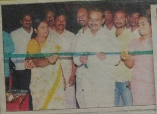
స్వచ్ఛంద సేవా సంస్థను ప్రారంభిస్తున్న మంత్రి కుమారి