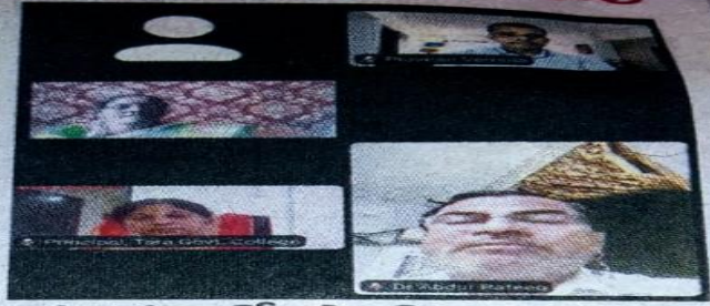
సదస్సులో పాల్గొన్న వక్తలు