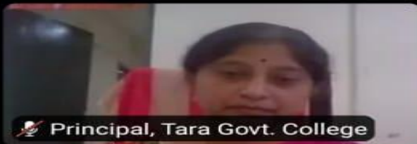
Principal, Tara Govt. College