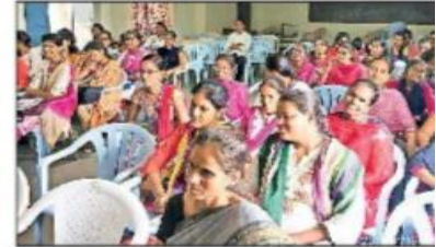
హాజరైన విద్యార్థినులు, యువతులు