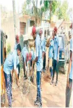
వెళ్ల తొలగిస్తున్న ఎన్ఎస్ఎస్ వలంటీర్లు