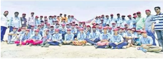
జఫర్గడ్ లక్ష్మీనరసింహస్వామి కొండను సందర్శించిన విద్యార్థులు

జఫర్గడ్, ఏప్రిల్ 5 : కాకతీయ విశ్వ విద్యాలయం ఆద్యర్థంలో మండల కేంద్రంలోని ఆదర్శ పాఠశాలలో నిర్వహిస్తున్న రాష్ట్ర స్థాయి శిబిరంలో భాగంగా రెండవ రోజు విద్యార్థులు మండల కేంద్రంలోని లక్ష్మీనరసింహస్వామి గుట్టను శుభ్రతరం సందర్శించారు. ఈ శిబిరంలో పాల్గొన్న 80 మంది వలంటీర్లు పర్యావరణ కాపాడకపోవడానికి పలు సాహస కార్యక్రమాలు చేశారు.