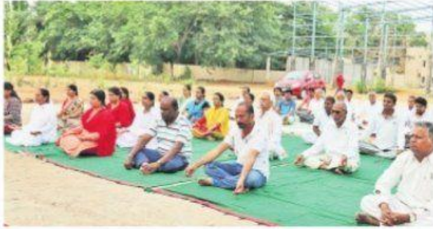
సంగారెడ్డి చౌరస్తా: తారా కళాశాలలో యోగాసనాలు చేస్తున్న బ్రహ్మకుమారీలు, కళాశాల ప్రెస్సిపాల్, అధ్యాపకులు

★ తారా ప్రభుత్వ డిగ్రీ కళాశాలలో శుక్రవారం ఎన్సీసీ, ఎన్ఎస్ఎస్ ఆధ్వర్యంలో అంతర్జాతీయ యోగా దినోత్సవ వేడుకల్ని నిర్వహించారు.