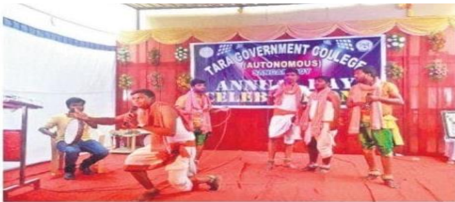
స్టూడెంట్ల నాటక ప్రదర్శనలు

Observed 100 th Jallian Wala Bagh Massacre Day on 13-04-2019.