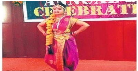
డ్యాన్స్ చేస్తున్న స్టూడెంట్