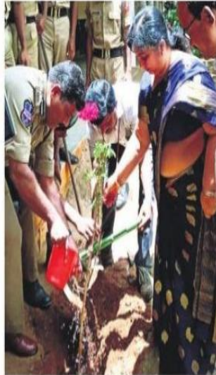
మొక్క నాటుతున్న ఎస్సీ ప్రిన్సిపాల్