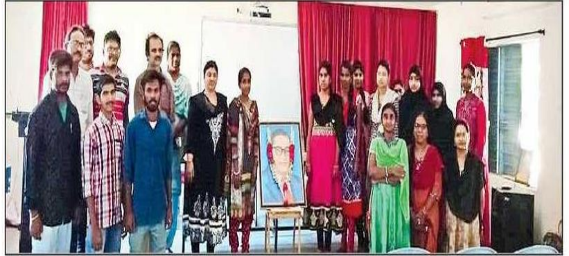
సంగారెడ్డిలో.. నివాళులు అర్పిస్తూ..