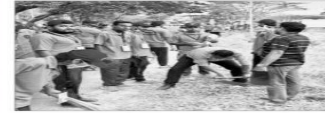
రోడ్డుపై చెక్కను శుభ్రం చేస్తున్న వలంటీర్లు