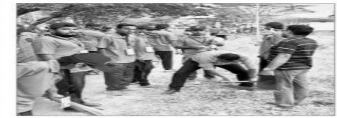
రోడ్డుపై చెక్కను శుభ్రం చేస్తున్న వలంటీర్లు