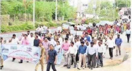
నీటి సరంజాంపై ప్రజలతో కలెక్టర్లు విద్యార్థులు విద్యార్థులు