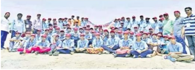
జఫర్గడ్ లక్ష్మీనరసింహస్వామి కొండను సందర్శించిన విద్యార్థులు

జఫర్గడ్, ఏప్రిల్ 5 : కాకతీయ విశ్వ విద్యాలయం ఆదర్శలో మండల కేంద్రంలోని ఆదర్శ పాఠశాలలో నిర్వహిస్తున్న రాష్ట్ర స్థాయి శిబిరంలో భాగంగా రెండవ రోజు విద్యార్థులు మండల కేంద్రంలోని లక్ష్మీనరసింహస్వామి గుట్టను శుభ్రపారం సందర్శించారు. ఈ శిబిరంలో పాల్గొన్న 80 మంది వలంటీర్లు పర్వతారోహణ కార్యక్రమం ద్వారా పలు సాహస కార్యక్రమాలు చేశారు.