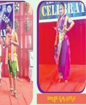
విద్యార్థి వ్యక్తి ప్రదర్శన