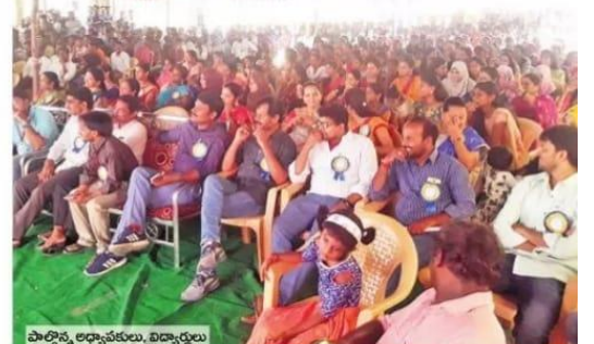
పాల్గొన్న అధ్యాపకులు, విద్యార్థులు

Wed, 01 May 2019 https://epaper.ntnews.com/c/38986633