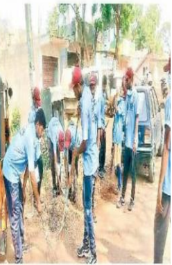
పెత్త తొలగిస్తున్న ఎన్ఎస్ఎస్ కలంటీర్లు