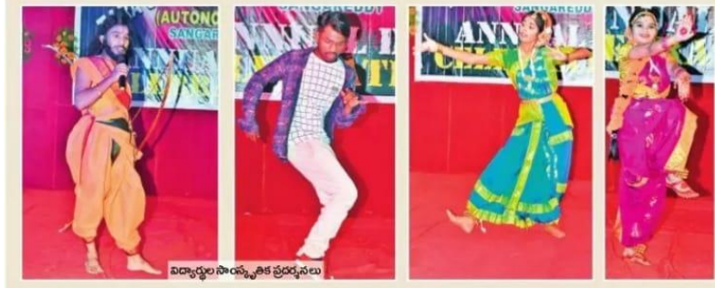
విద్యార్థుల సాంస్కృతిక ప్రదర్శనలు