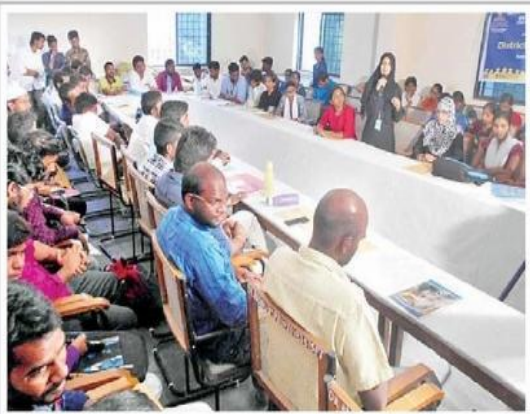
ఉమ్మడి మెడక్ జిల్లా స్థాయి యూత్ పార్లమెంట్ నిర్వహణ (పాఠశాల)