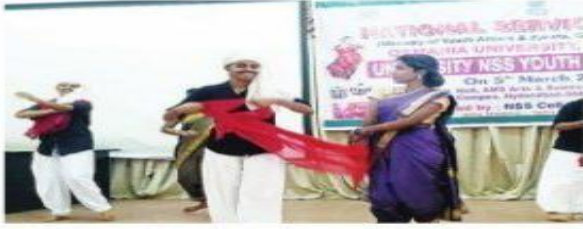
సాంస్కృతిక కార్యక్రమాల్లో విద్యార్థులు