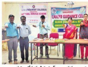
ప్రతిజ్ఞ చేస్తున్న ప్రిన్సిపాల్, అధ్యాపకులు, అధికారులు