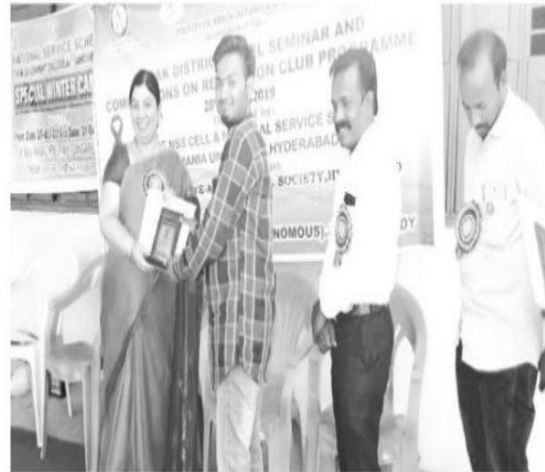
ప్రతిభ కుబ్జుని వారికి బహుమతులు ప్రధానం చేస్తున్న ప్రిన్సిపాల్