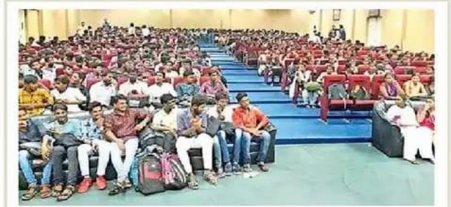
వెబ్ క్యాస్టింగ్ శిక్షణకు హాజరైన విద్యార్థులు

వెబ్ క్యాస్టింగ్ విధులకు 600 మంది విద్యార్థులు అవసరమని అధికారులు చెప్పడంతో విద్యార్థులు పరిపాలన కార్యాలయానికి చేరుకున్నారు.