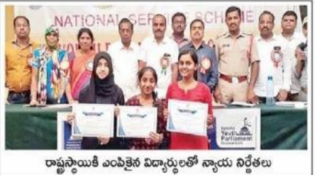
రాష్ట్రస్థాయికి ఎంపికైన విద్యార్థులతో న్యాయ నిర్దేశాలు

▼ విశ్వవ్యాప్తంగా ఎదుర్కొంటున్న ఉగ్రవాద సవాళ్ళు-భారతదేశం తీసుకుంటున్న చర్యలు. ▼ ఆర్థిక నేతగళ్ళ వ్యాప్తి-చర్యలు ▼ వర్తమానంలో జరుగుతున్న మార్పులు - చేపడుతున్న చర్యలు ▼ ఖేలో ఇండియా- వర్తమాన క్రీడాకారులకు క్రీడలు ముఖ ద్వారం వంటిది. క్రీడలను ప్రోత్సహించే దిశగా ప్రభుత్వం తీసుకుంటున్న చర్యలు.