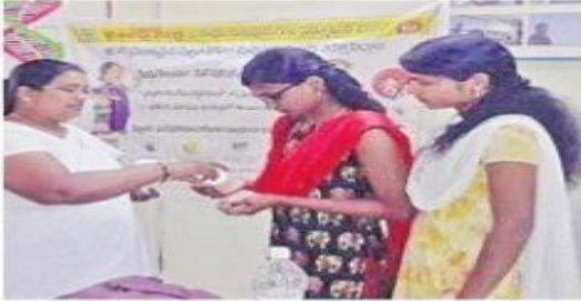
విద్యార్థులకు మాత్రలు పంపిణీ చేస్తున్న వైద్య సిబ్బంది