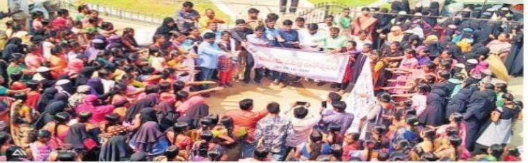
సదాశివపేట టౌన్: ఓటుహక్కు దినోత్సవంలో ప్రతిష్ఠ చేస్తున్న యువత, యువకులు