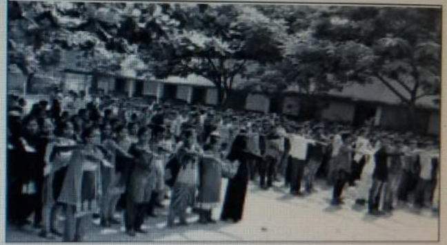
ప్రతిజ్ఞ చేస్తున్న విద్యార్థులు