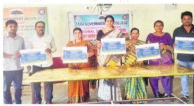
స్ట్రీనింగ్ టెస్ట్ ల కరపత్రాన్ని విడుదల చేస్తున్న ప్రిన్సిపాల్