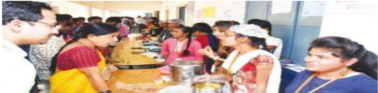
వంటల గురించి వివరిస్తున్న విద్యార్థులు