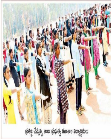
ప్రతిష్ట చేస్తున్న తారా ప్రభుత్వ కళాశాల విద్యార్థులు

Sun, 20 January 2019 https://epaper.ntnews.com/c/359392