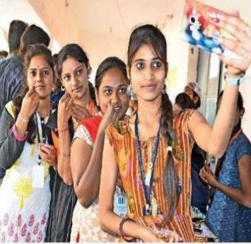
వంటకాలు రుచి చూస్తున్న వీధి చిత్రం దిగదాం..!