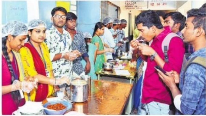
స్టాల్లోని వంటకాలను రుచి చూస్తున్న విద్యార్థులు

తెలంగాణ అభిరుచులను తెలిపే పోటీలు, రోటీ, గుడ్డి వంకాయ, షీర్ఖుమ, సకినాలు, జొన్న రొట్టె, గడ్డినువ్వుల పొడి, రాగి జావ, కాకినాడ ఖాజా, వెజ్ బియ్యని, నాన్ వెజ్ వంటకాలు, పులిహోర తదితర 37 రకాల వంట పదార్థాలను తయారు చేసి తక్కువ ధరలకు విక్రయించారు.