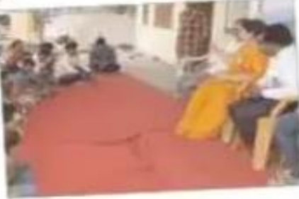
కార్యక్రమానికి ముఖ్య అతిథిగా విచ్చేసిన జిల్లా ఎయిడ్స్ కంట్రోల్ సొసైటీ అధికారి