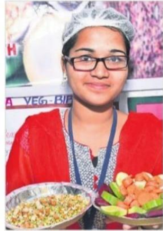
వెజిటబుల్ సలాడ్, మొలకెత్తిన గింజలతో విద్యార్థిని