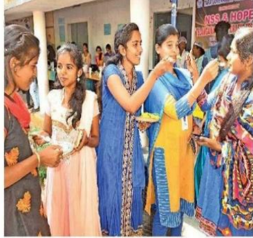
జతలొకట రివీంచుకుంటున్న విద్యార్థులు

సూన్రూపే, సంగారెడ్డి అర్బన్ తెలంగాణ విద్యార్థులు వివిధ కళాశాలలు, ఇంటి వైద్యం, ఉపాధ్యాయులు చేస్తుంది వివరం... విశ్వం కృష్ణమూర్తి. కాస్త ఖాళీ సమయం దొరికితే కుటుంబం కాలేజీకి వస్తారు. అలాంటి విద్యార్థులు తోచుకుంటే వంటకాలను ప్రదర్శించారు. అలాగే ఏమీ రుచి... అంటూ అభ్యసించారు. ఇందుకు సంగారెడ్డిలో ప్రభుత్వ తారా డిగ్రీ కళాశాల వేదికగా మారింది. తెలంగాణ సాంస్కృతిక సంప్రదాయాలైన వంటకాలపై అవగాహన కల్పించాలని సుకల్పాలో కళాశాల యాజమాన్యం ముందుకొచ్చింది. తొలిసారిగా మంగళవారం సంగారెడ్డిలోని ప్రభుత్వ తారా డిగ్రీ కళాశాలలో 'ఫుడ్ ఫెస్టివల్'ను మనగా చేపట్టింది. దీంతో కళాశాల ఇంటర్నల్ విద్యార్థులతో సందడిగా మారింది. నోరారిన వంటకాలను విద్యార్థులు ప్రదర్శించారు. జొన్నలొట్టె, బిరెన్, మసూన్ దిబ్బా, ఫిరకీ, అలబి, వర్షిపంకాయ, పెరుగుపప్పు, తిరిగి 81 రకాల వైటింగుల ప్రదర్శించారు. మరోవైపు పప్పు పాల్టలు, డబ్బెలీమీదా, సుప్రీం అప్పలు, సుపరిగి పప్పుల తారా రుచి చేసిన మెరుగైన అభివృద్ధిని అక్కడే ఈ విద్యార్థులు అభ్యసించారు. కళాశాల ప్రధాన కార్యదర్శి, అధ్యాపక బృందం సహజంగా రుచికరమైన వంటకాలను ఎంతో చేశారు.