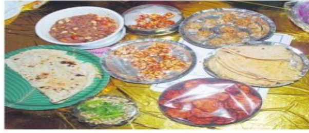
ఫుడ్ ఫెస్టివల్లో వివిధ రకాల వంటకాలను ప్రదర్శిస్తున్న విద్యార్థులు. ప్రదర్శనకు ఉంచిన వంటకాలు

ఈనాడు సంగారెడ్డి బుధవారం 27 ఫిబ్రవరి 2019