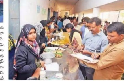
స్టాళ్లను పరిశీలిస్తున్న న్యాయనిర్ణేతలు