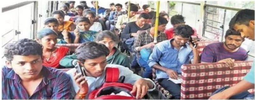
బస్సుల్లో బయలుదేరిన వెబ్ క్యాస్టింగ్ బృందాలు

తమందరికీ సర్టిఫికేట్ తో డబ్బులు ఇవ్వాలిందేనని అధికారులతో పట్టుబట్టారు. సంబంధిత కళాశాల అధ్యక్షుడు నచ్చజెప్పడంతో శాంతించిన విద్యార్థులు సాయంత్రం 5 గంటల వరకు వేచి చూసి చేసేదేమీలేక వెనుదిరిగి వెళ్ళారు. మరోవైపు ఒక్కో నియోజకవర్గం వారీగా మొత్తం ఐదు నియోజకవర్గాలకు దాదాపు 250 మంది విద్యార్థులను ఎంపిక చేసి సాయంత్రానికి వివిధ ప్రాంతాలకు పంపించారు.