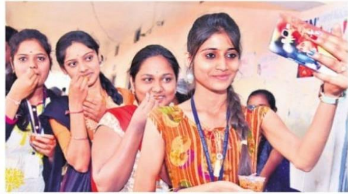
వుడ్ ఫెస్టివల్లో విద్యార్థినుల సెట్టి

కొండాపూర్(సంగారెడ్డి): సంగారెడ్డిలోని తారా ప్రభుత్వ డిగ్రీ కళాశాలతో మంగళవారం తెలంగాణ వుడ్ ఫెస్టివల్ వేడుకలను ఘనంగా నిర్వహించారు. ఈ సందర్భంగా విద్యార్థులు తయారుచేసిన వివిధ రకాల వంటకాలను స్టాల్లపై ప్రదర్శించారు. ఈ వుడ్ ఫెస్టివల్లో