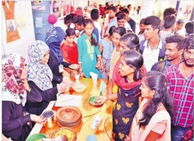
స్టాల్లోని వంటకాల గురించి అడిగి తెలుసుకుంటున్న విద్యార్థులు