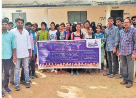
యూత్ పార్లమెంట్ స్ట్రీనింగ్ లో పాల్గొన్న విద్యార్థులు