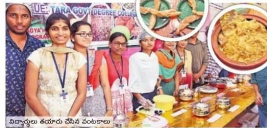
విద్యార్థులు తయారు చేసిన వంటకాలు