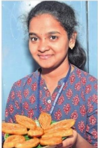
కాకినాడ ఖాజాలతో విద్యార్థిని