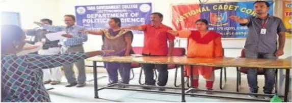
సంగారెడ్డి చౌరస్తా: ప్రతిష్ఠ చేస్తున్న ప్రీన్సిపాల్, అధ్యాపకులు

చేపట్టారు. శుక్రవారం తహసీల్దార్ కార్యాలయం నుంచి జాతీయ రహదారి మీదుగా గాంధీచౌక్ వరకు భారీ రాష్ట్రీ నిర్వహించారు. రాష్ట్రీలో ఓటు ప్రాముఖ్యతను వివరిస్తూ నినాదాలు చేశారు. డిగ్రీ కళాశాలలో ఓటుహక్కుపై విద్యార్థులకు అవగాహన కల్పించారు. ఓటు హక్కును పొందిన వారంతా ఓటుహక్కును వినయంగా ఉపయోగించుకుంటామని ప్రతిష్ఠను చేశారు. ఈ సందర్భంగా తహసీల్దార్ రాంరెడ్డి మాట్లాడుతూ 18 సంవత్సరాలు నిండిన యువత ఓటు హక్కును పొందేందుకు మీసేవా కేంద్రాల ద్వారా దరఖాస్తు చేసుకుని ఓటుహక్కును పొందాలన్నారు. ప్రజాస్వామ్యంలో నాయకులను ఎన్నుకునేందుకు ఓటుహక్కును కల్పించింద