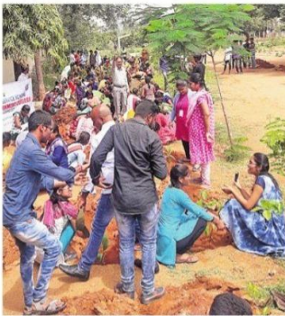
మొక్కలు నాటుతున్న విద్యార్థులు