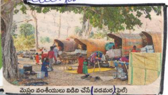
మెన్టం వంశీయులు విడివి చేసే (వడమర) ఫైల్