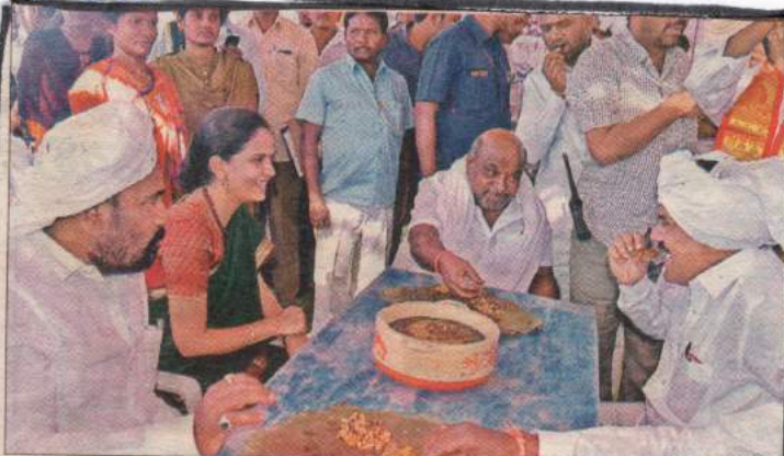
జోన్లలో రుచిని చూస్తున్న మంత్రి జోగురామన్న, కలెక్టర్ దివ్య ఎంపీ

→ తెలంగాణ రాష్ట్రంలో ప్రజలకు కలిగిన సమస్యల, సందేహాలను పరిష్కరించేందుకు ఏర్పాటు చేసిన అనియత సమస్యల పరిష్కారదోమం. నాగోబా జాతరలో జరిగిన దర్శార్లో ముఖ్యమంత్రి చేపట్టిన ఈ సమస్యల పరిష్కారదోమం తెలంగాణ ప్రజలకు కలిగిన సమస్యల పరిష్కారం కోసం ప్రత్యేకంగా ఏర్పాటు చేసిన అనియత సమస్యల పరిష్కారదోమం. నాగోబా జాతరలో గ్రామీణుల సమస్యల పరిష్కారం కోసం ఏర్పాటు చేసిన అనియత సమస్యల పరిష్కారదోమం.