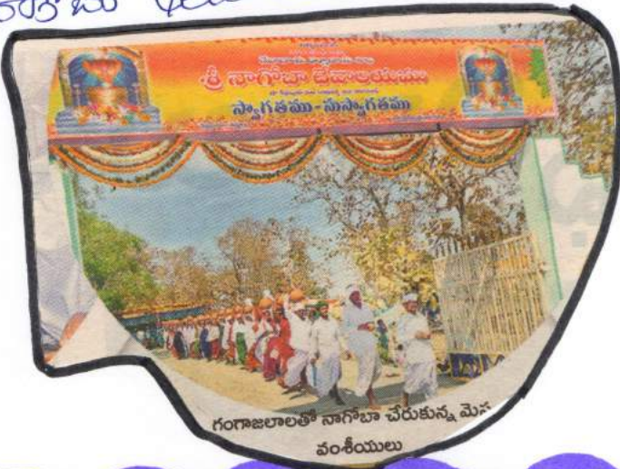
గంగాజలాలతో నాగోబా చేరుకున్న మేఘం వంశీయులు

కాల నడకన పనిత్రే బోలాళకు: తమ భరాధ్య దైవం నాగోబాను అభిషేకించేందుకు మేఘం మంకియంల పనిత్రే గుర్రా బోలాళు టంపయోకిస్తారు. ఇందు కోసం కాల నడకన సమీపం 15 రోజుల పాటు మేఘం మంకియంల అనాసం టంపే గ్రామాల గుండె కాలనడక యాత్రే సాగుతుంది. చుట్టూరితూ ఇండ్రపల్లె, నారబ్బూర్, శైవూర్, సిర్పూర్ (యం), ఆంకపూర్ మండలాల మొదట మేఘం మంకియంల జిన్నాబరం మండలం కలమేదురు రోవామల శివులొని అస్తినమేదురు చేరుకుంటారు. అస్తినమేదురు వద్ద ప్రత్యేక పూజలు ఆర్యసాంల పనిత్రే గుర్రాబోల తోషణిస్తారు. గుర్రా బోలాళతో పట్టణ మేఘం మంకియంల ఇండ్రపల్లెలొని ఇండ్రపల్లెలొకి ప్రత్యేక ప్రాసేల ఆర్యసాంల కస్తోపూర్లొని నాగోబా భుయూలొకి సమిపయొని టంపే మేఘం చెట్ల వద్ద అడివి దేస్తారు.