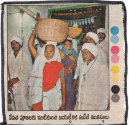
దేవత పూజలకు ఇంటినుంచి బయల్దేరిన పటేల్ వంశీయులు