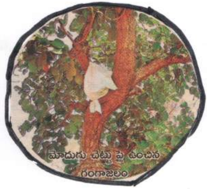
మోదుగు చెట్టు పై ఉంచిన గంగాజలం