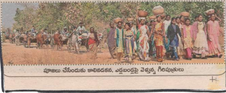
పూజలు చేసేందుకు కాలినడకన, ఎడ్లబండ్లపై వెళ్తున్న గిరిపుత్రులు

గిరిజనుల ఆరాధ్య దైవమైన నాగోబా జాతర ప్రారంభానికి ముందు గిరిజనులు వివిధ దేవతలకు పూజలు చేయడం ఆనవాయితీగా వస్తోంది. ఆదిలాబాద్ మండలంలోని చిన్న వందర్లొద్ద, పెద్దపందిరిలొద్ద గ్రామస్థులు దేవ తామూర్తుల విగ్రహాలతో పూజలు చేసేందుకు మరో గ్రామానికి సమీపంలోని చెరువు వద్దకు బయలుదేరారు. అడవులోంచి కాలినడకన వాగులు, వంకలు దాటుకుంటూ ఎడ్లబండ్లపై వెళ్తున్నారు. శుక్రవారం గుండంలొద్ద గ్రామ సమీపంలో కనిపించిన చిత్రమిది.