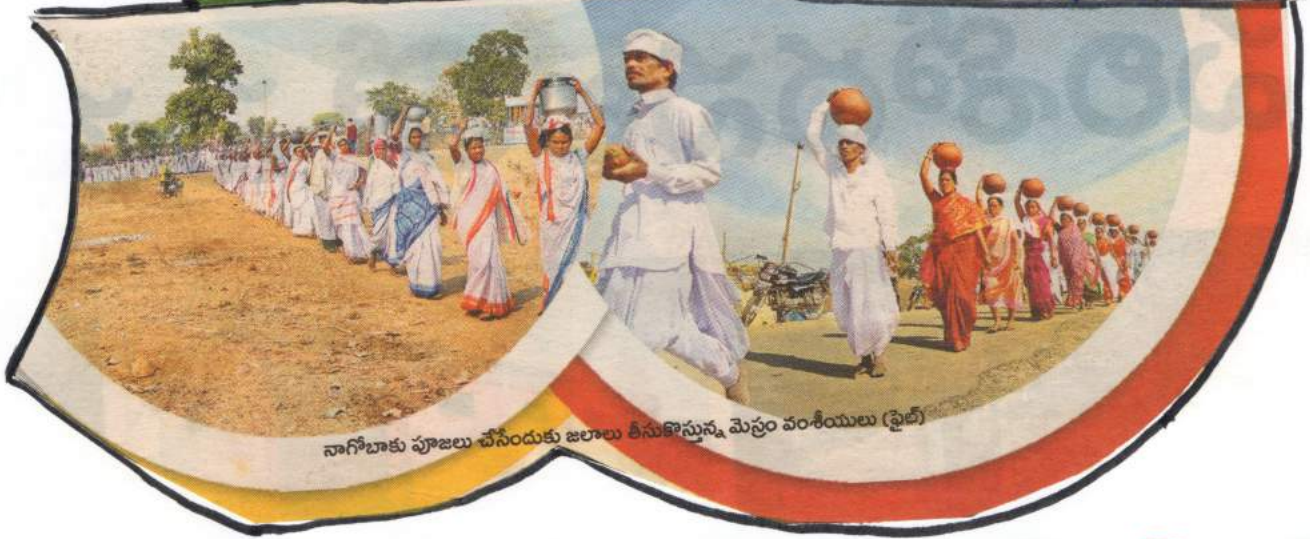
నాగిబాకు పూజలు చేసేందుకు జలాల తీసుకొస్తున్న మెన్టం వంశీయులు (ఫైల్)