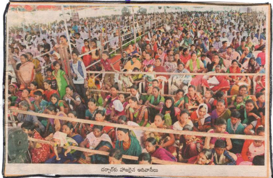
దర్బార్కు హాజరైన ఆదివాసీలు