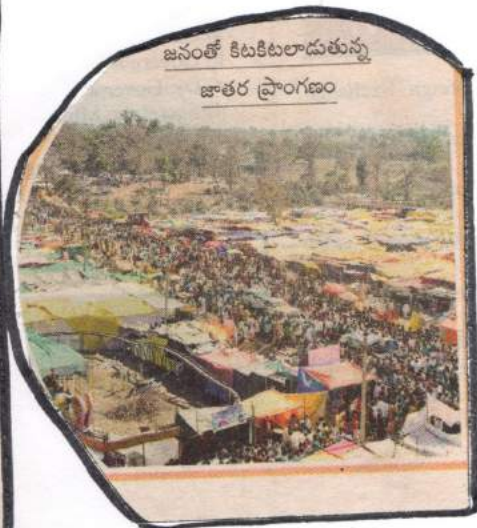
జనంలో కిటకిటలాడుతున్న జాతర ప్రాంగణం

→ అనియత సమస్యలు తెలపటాని పరిష్కారంకోసం నాగోబా సంక్రమణి 63 యొక్క చురుకైన కౌశలాలను కలిపి దర్శార్.