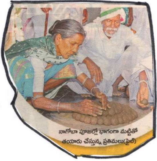
నాగోబా పూజల్లో భాగంగా మట్టితో తయారు చేస్తున్న ప్రతిమలు(ఫైల్)

→ జాతీయ నాయకులకు ముందు గిరిజియలు తమూరు సేసిన కారణంతో గూడలు కోసం బయలుదేరుతారు. పొత్తి దిలు సేకరించి తోడుతున్నారని నాటం పద్మ కుంజల (బాబుల)ను భలయూ వద్ద గిరిజియల నుండి ఉపయోగిస్తారు దానిం -తెలకు ప్రాజెక్టు పంజలను గిరిజియ భలయూ పంజం ప్రాంతాల్లో వివిధ రకాల పింజి వంటలతో పాటు సైనేద్దురు తయారు చేయడాడో వారుతారు .