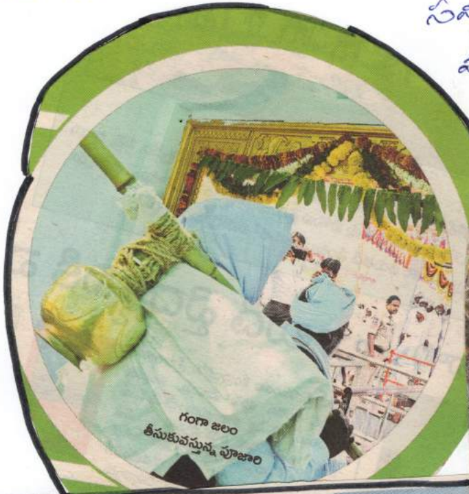
గంగా జలం తీసుకువస్తున్న పూజారి

సంస్థలలోను ముందు ప్రారంభమైంది వందలకు చేరుకొని అందరినైతే చేస్తారు. నాగిబా ప్రారంభం భద్రాద్రి కూడ వందలకు 16న అందరినైతే ముందునంద్యాల ప్రారంభం అందరినైతే.