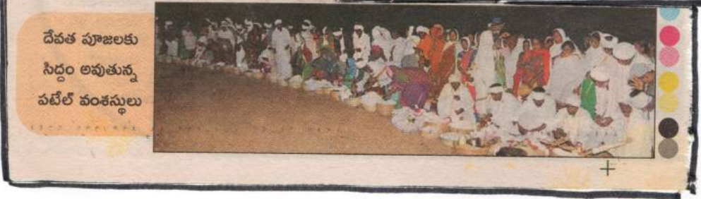
దేవత పూజలకు సిద్ధం అవుతున్న పటేల్ వంశీయులు

నాగోబా మహాపూజకు అవసరమయ్యే రేణువులతో ఈ సల 12న మూల చెట్టు వద్దకు చేరిన మునుపే వంశీయులు మూల చెట్టు వద్ద రేణువుల పాటు నిత్రాంత్ర తీసుకొని అవివారం కాత్రీ తీయమే పూజలు అర్చనలవారు. మునుపే వంశీయుల 22 కితల్లో మొదటివారి 10 మంది మేలం తీయమే పూజలు అర్చనలవారు ఈ పూజలు అర్చనలవారు వల్ల మరలవారి వారు నాగోబా సన్నిధికి వెళతారు మునుపే వంశీయుల నమ్మకం అది విధానం మూల చెట్టు వద్ద బస చేసిన మేలం వంశీయులు 22 కితలవారూ వంటలు చేసి సహపాక్తి భోజనాలు చేశారు.