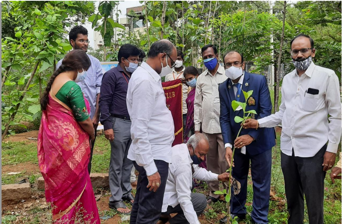
Tree Plantation in the college campus