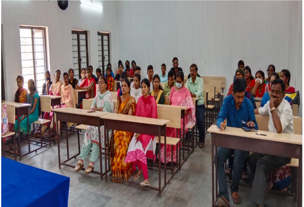
Attended staff and students in the felicitation programme “ SHATHAMANAM BHAVATHI ’.