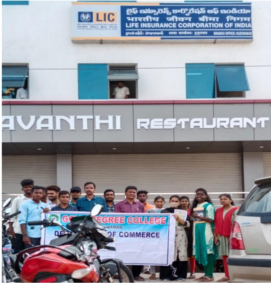
Our students at “LIFE INSURANCE CORPORATION – HUZURABAD BRANCH”