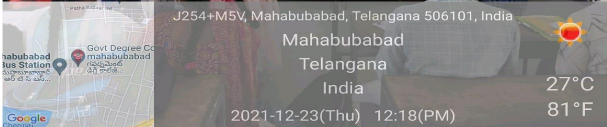
Students participating in Body Language presentation