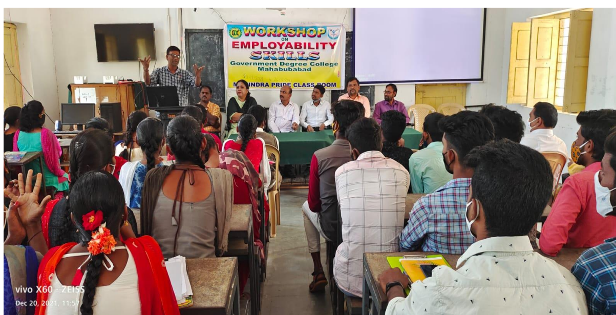
All the Faculties actively participated and encouraged the students