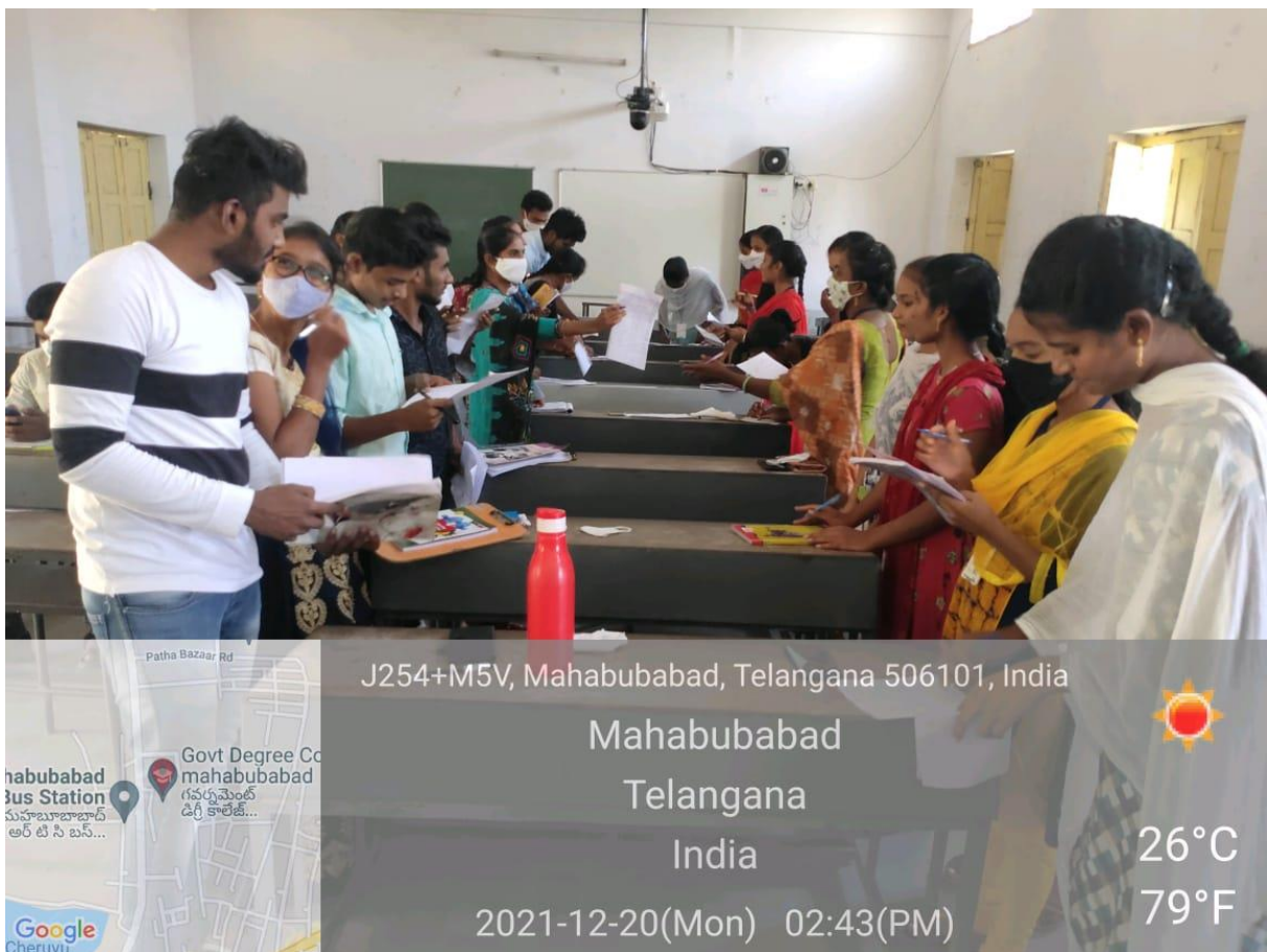
Students participation in Qualities of Students activity