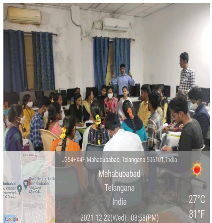
Students participation in Group Discussion