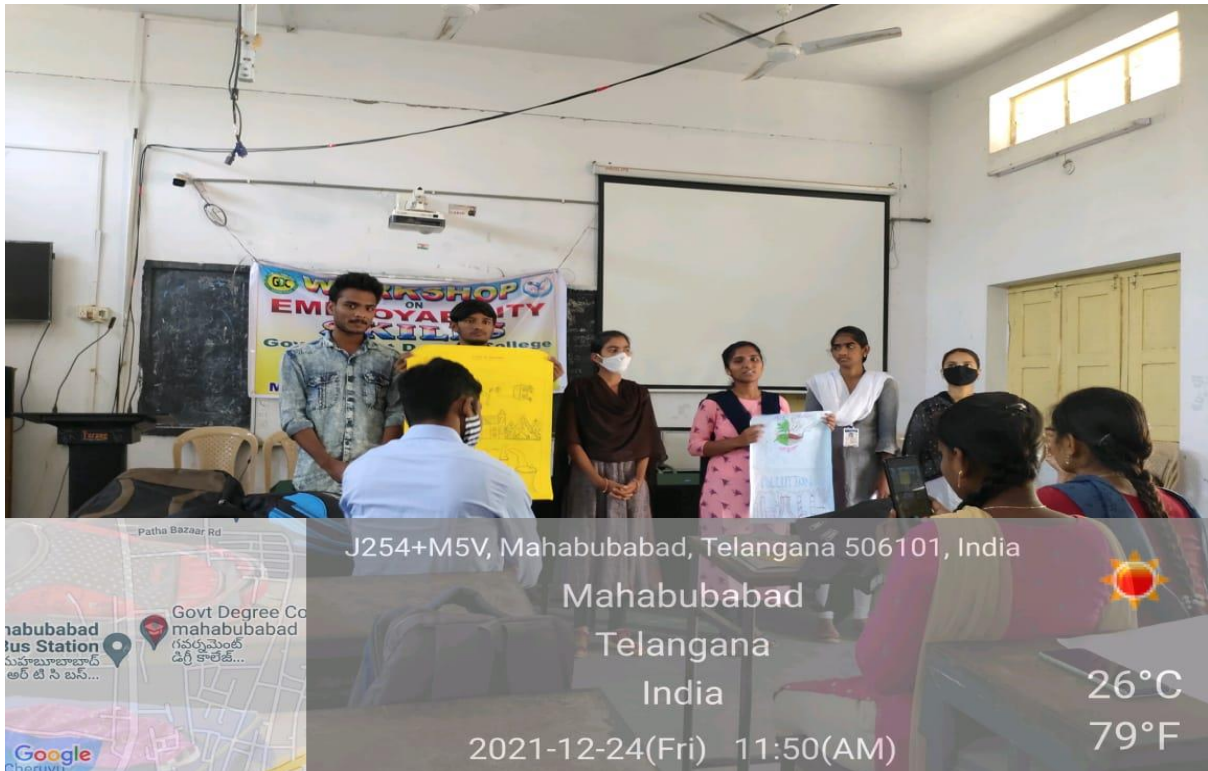
Students participating in Paper Presentation