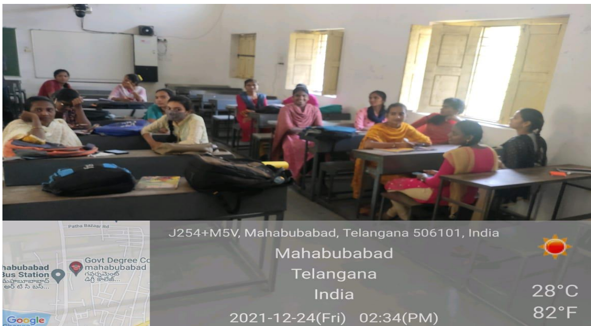
Students participation in Interview Skills (Mock Interviews)