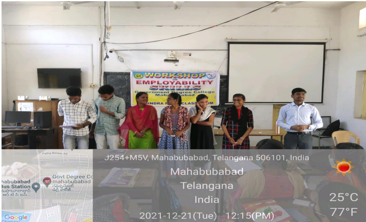
Students participation in Goal Setting