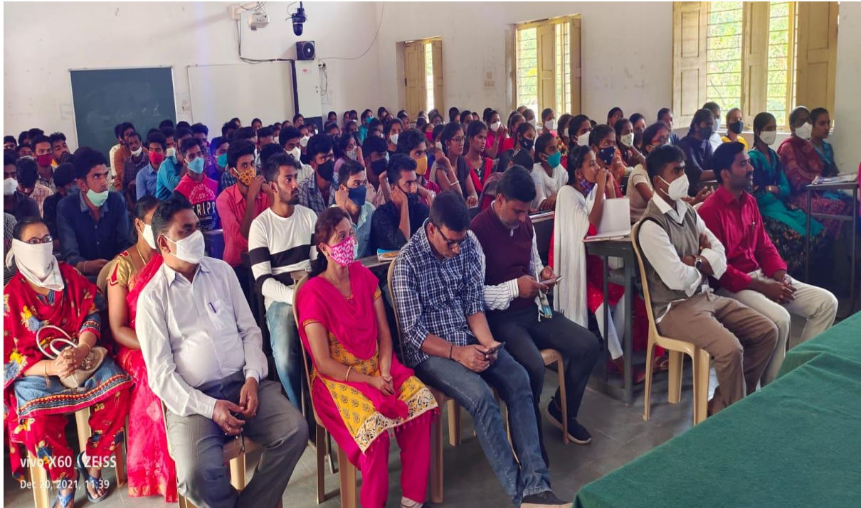
Students participation in Inaugural session in Mahindra Pride Classroom