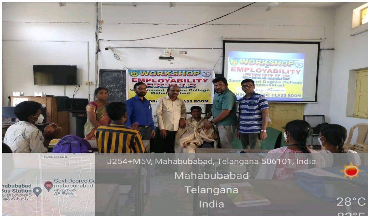
Felicitation to the Resource Person