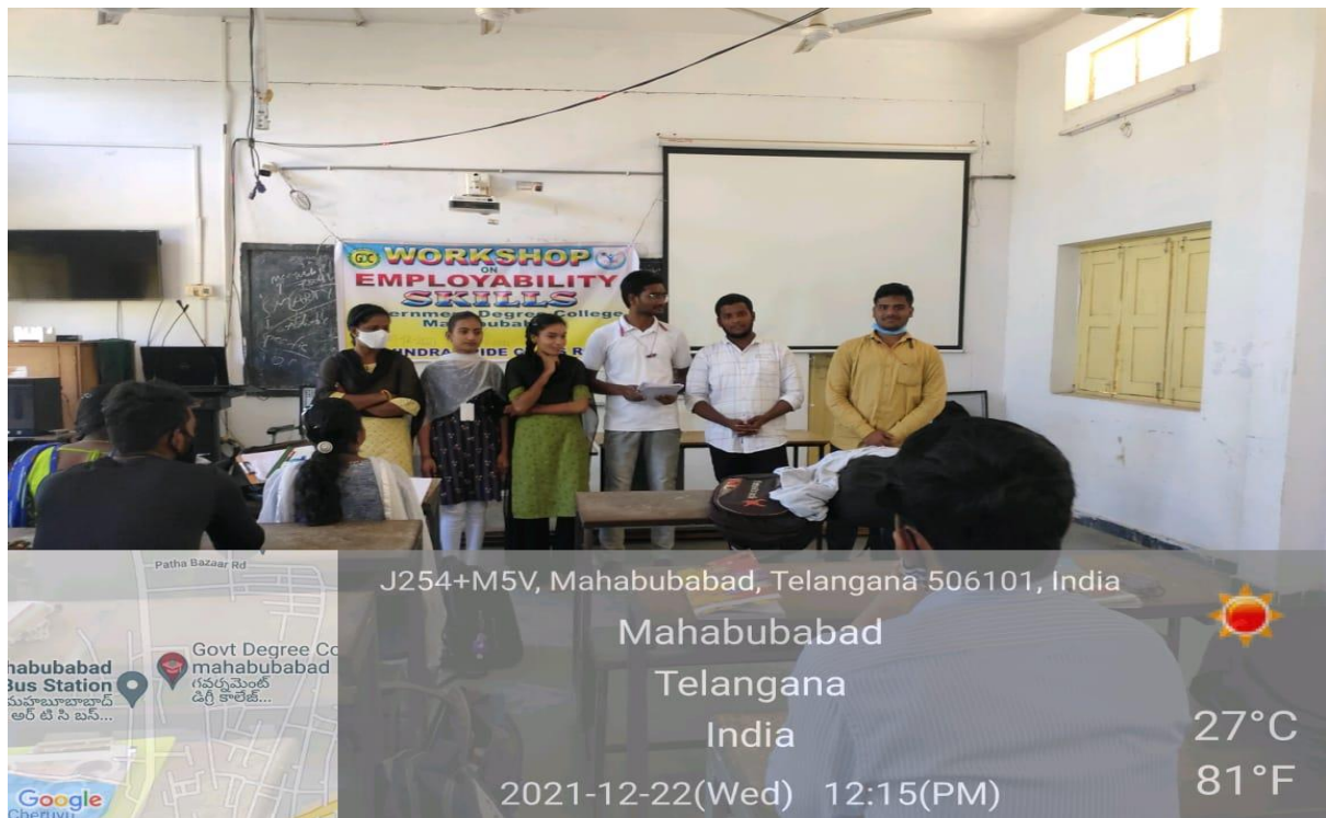
Students participation in Group Activities