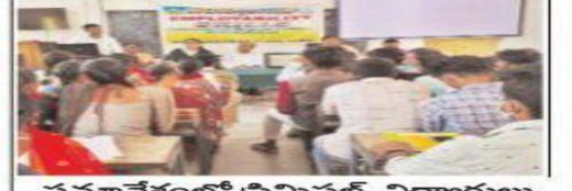
నమావేశంలో ప్రిన్సిపల్, విద్యార్థులు

మహబూబాబాద్ ఎడ్యుకేషన్, డిసెంబర్ 20 (ప్రభుత్వ):