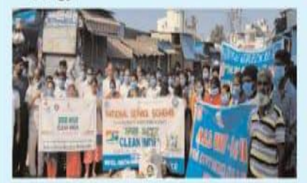
§ර් කාරුණ දේල්ලාඒ රටහිංහ එල්ර

$వ్ ఇంకియా' ఇద్దర్వంలో పలసూలు శుభ్రం anextur වේවෙන්වේ ජී-පසුන්වර් පතිති