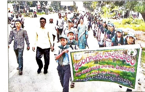
ఊరుశ్రీరాంపూర్లో ర్యాలీ నిర్వహిస్తున్న విద్యార్థులు