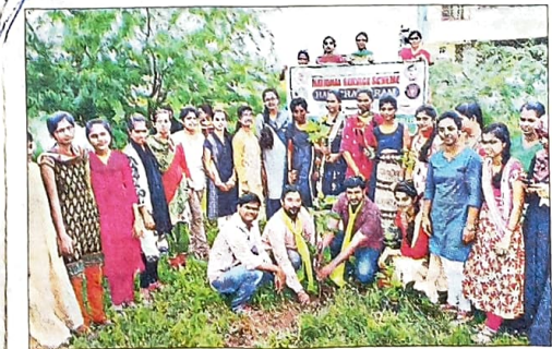
మంచిర్యాల ప్రభుత్వ డిగ్రీ కళాశాల ఆవరణలో మొక్కలు నాటుతున్న విద్యార్థులు