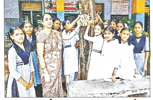
చెట్లకు రాబీలు కడుతున్న మంచిర్యాల జడ్పీ బాలికల ఉన్నత పాఠశాల విద్యార్థినులు