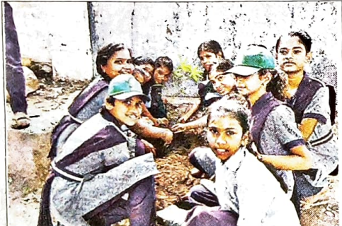
ముల్గుల పాఠశాలలో మొక్కలు నాటుతున్న విద్యార్థులు