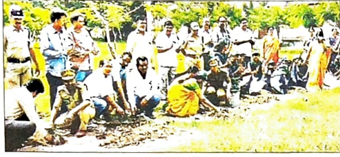
దండేపల్లి ఉన్నత పాఠశాలలో మొక్కలు నాటుతున్న అధికారులు, విద్యార్థులు