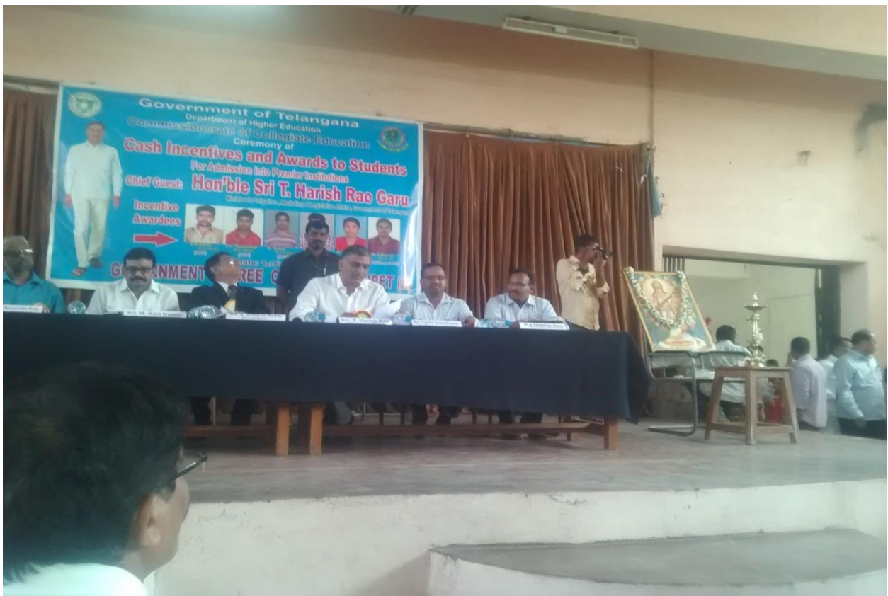
Second UGC Sponsored Two Day Seminar on CBCs during, December 28-29 th , 2016.