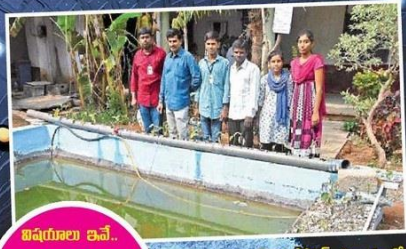
విషయాలైతే.. అన్ని భాషలు సామాజిక శాస్త్రాలు భౌతిక శాస్త్రాలు జీవశాస్త్రాలు వాణిజ్య శాస్త్రం అక్కా పోస్ట్ విద్యాలంలో కుత్స్న మొక్కల పెంపకాన్ని వివరిస్తూ.. ప్రాజెక్టుల రూపకల్పనలో విద్యార్థులకు ప్రయోజనాలు జిల్లా..