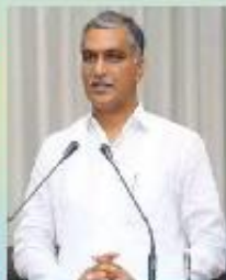
Sri. T. Harish Rao Hon'ble Minister For Finance T.S