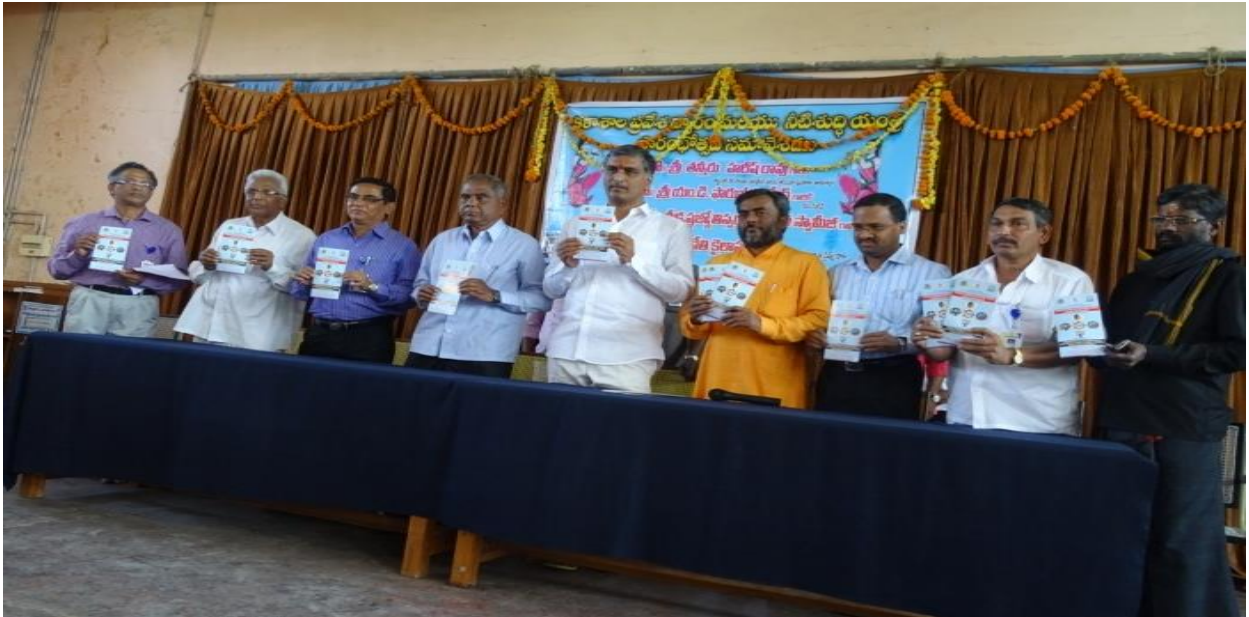
Honorable Minister for Major Irrigation Government of Telangana Releasing Our Seminar Brochure along with other respected people.