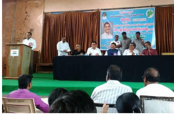
Felicitations Received by the Faculty of the Department on Different occasions