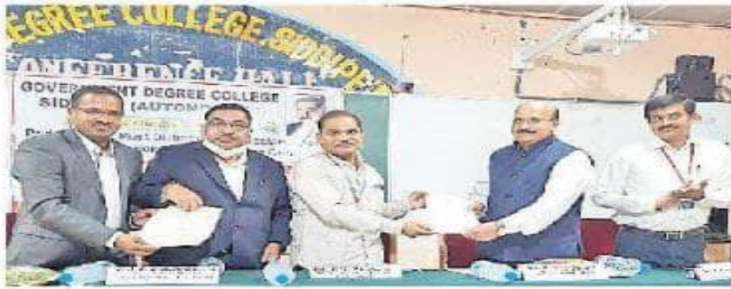
సంస్థతో ఎంపీయూ ఒప్పంద పత్రాన్ని కుదుర్చుకుంటున్న అధ్యాపకులు