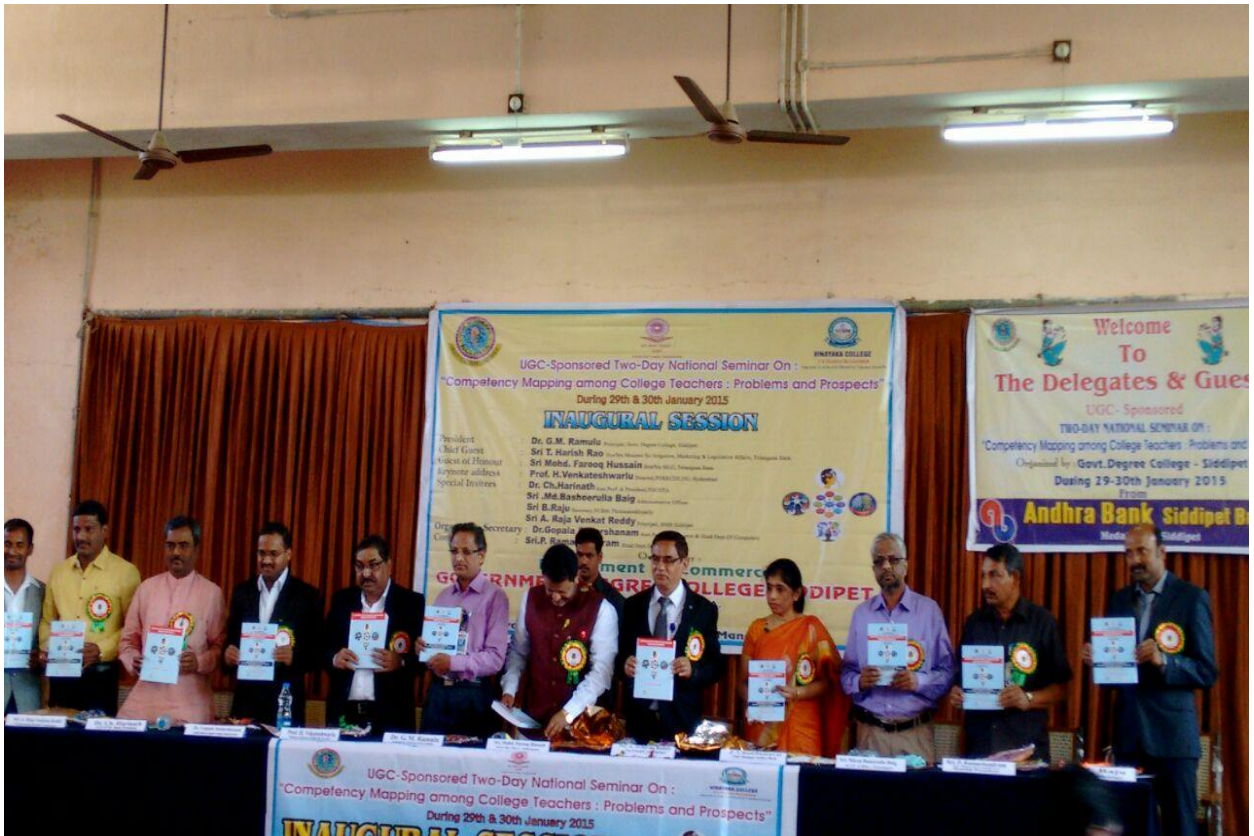
Guests on the dias releasing the ISBN Volume of research papers presented in the seminar