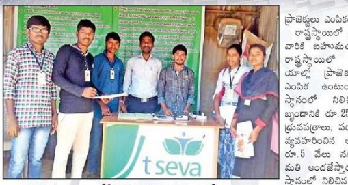
నగదు రహిత లావాదేవీల ప్రాజెక్టు రూపకల్పనలో విద్యార్థులు

నగదు రహిత లావాదేవీలపై.. వాణిజ్యశాస్త్రం విభాగంలో.. సిద్దిపేట ప్రభుత్వ డిగ్రీ కళాశాల విద్యార్థులు 'సిద్దిపేట రైతుబజారులో నగదు రహిత లావాదేవీలు - కొనుగోలుదారులు, వినియోగదారుల అలోచనలపై ప్రాజెక్టు రూపొందించారు. పెద్దకోట్ల రకపు తరువాత ఎలాంటి జిల్లాపనులు ఎదురొచ్చాయి, నగదు రహిత లావాదేవీలతో కలిగి ప్రయోజనాలు, నిరక్షరాస్యుల ఇళ్ళిట్లు, తదితర అంశాలను సృజించారు. ప్రాజెక్టుకు రూపకల్పన చేశారు. ఐదులో భాగంగా రైతులు, కొనుగోలుదారుల అభిప్రాయాలు సేకరించారు. ప్రత్యేకంగా ప్రశ్నావళిని రూపొందించి సృష్టించిన సమాచారాలు రాబట్టారు. క్రైస్తవ్యంలో రైతులతో ముఖాముఖి నిర్వహించారు. అధికారుల ద్వారా సమాచారాన్ని సేకరించారు. ప్రాజెక్టు ఫలితం: పెద్దకోట్ల రకపుతో భరణం తగ్గాయి. చిల్లర సమస్యను పూర్తిస్థాయిలో పరిష్కరించాల్సి ఉంది. నగదు రహిత చెల్లింపులపై ప్రజలకు విస్తృత అవగాహన కల్పించాలి. తదితర వాటిని విద్యార్థులు గుర్తించారు.