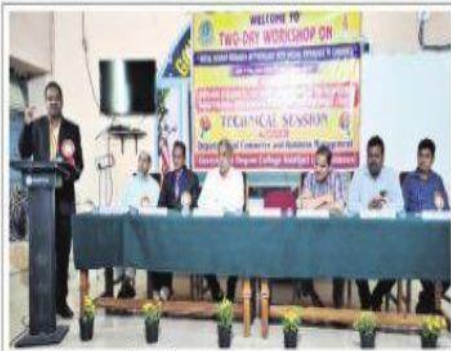
సమావేశంలో మాట్లాడుతున్న నిర్వాహకులు

సిద్దిపేట ప్రతినిధి, నవంబర్ 12 (ప్రభ న్యూస్) : స్థానిక ప్రభుత్వ డిగ్రీ కళాశాల, సిద్దిపేటలో శుక్రవారం కామర్స్ అండ్ బిజినెస్ మేనేజ్మెంట్ విభాగం ఆధ్వర్యంలో ఇండి