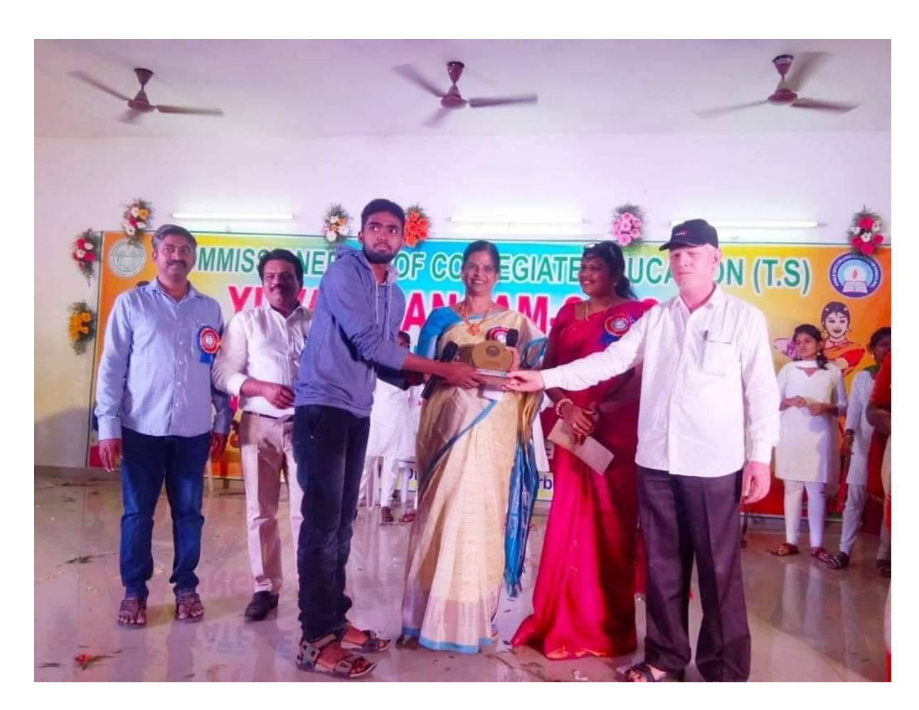
STATE LEVEL SKITS