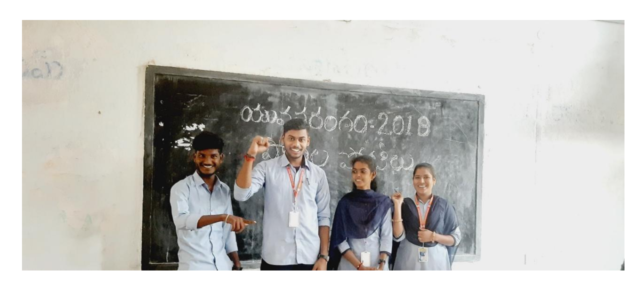
COLLEGE LEVEL FOLK SONG (GROUP) COMPETITIONS