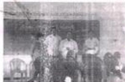
CELEBRATION OF SRINIVASA RAMANUJAN BIRTH DAY CELEBRATION ON 22/12/2014