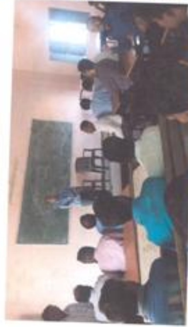
सभा-समवेत में निमंत्रण करते हुये राजपाल हिन्दी प्रकाशन