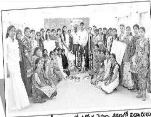
ప్రభుత్వ మహిళా డిగ్రీ కళాశాలలో ఉద్యోగ నైపుణ్య శిక్షణలో విద్యార్థులు

● నాంది ఫౌండేషన్ ఆధ్వర్యంలో ప్రభుత్వ మహిళా కళాశాలలో ఉద్యోగ నైపుణ్య శిక్షణ