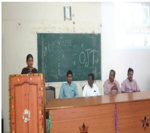
iii. STUDENT OPINION ON OJT