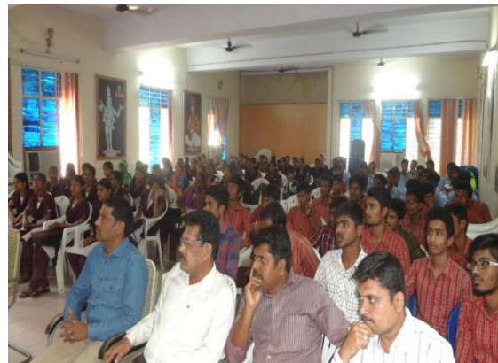
ii. STUDENT & ST