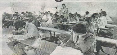
పరీక్ష రాస్తున్న అభ్యర్థులు