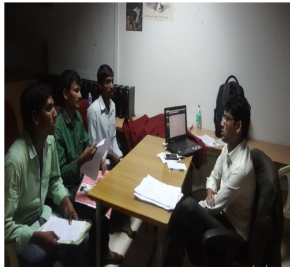
iv. Job drive group discussion