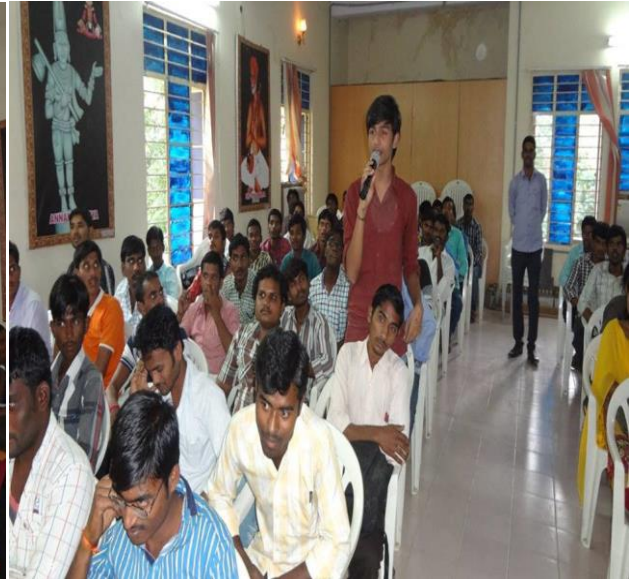
iv. STUDENT EXPRESSING VIEWS ON JKC