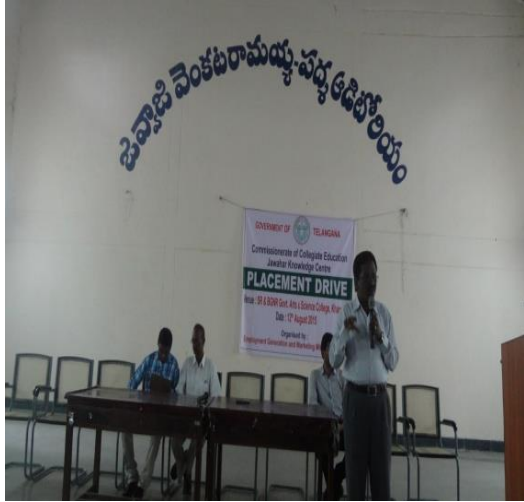
I. Principal speech regarding job drive