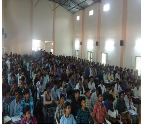
ii. Students attending to the job drive