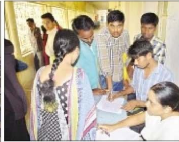
పరీక్ష రాస్తున్న దృశ్యం, పేర్లు నమోదు చేయించుకుంటున్న నిరుద్యోగులు