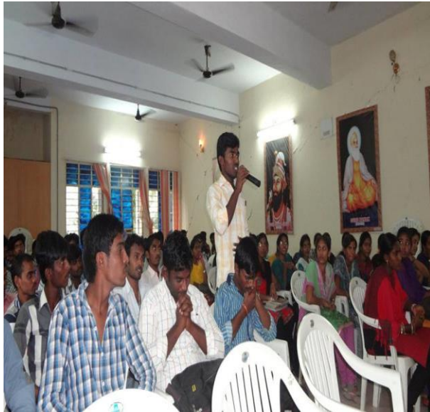
iii. STUDENT OPINION ON JKC

i. PAPER CLIPPING IN NAVA TELANGANA , ii. PAPER CLIPPING IN SAKSHI .