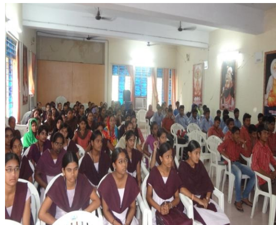
iv. STUDENTS ATTEND TO THE OJT