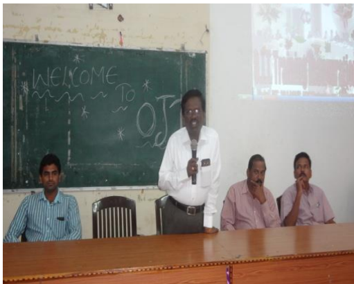
i. PRINCIPAL SPEECH ON OJT