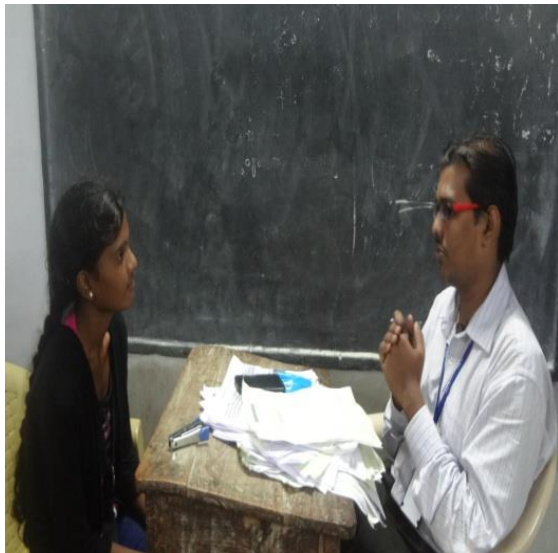
iii. Job drive personal interview