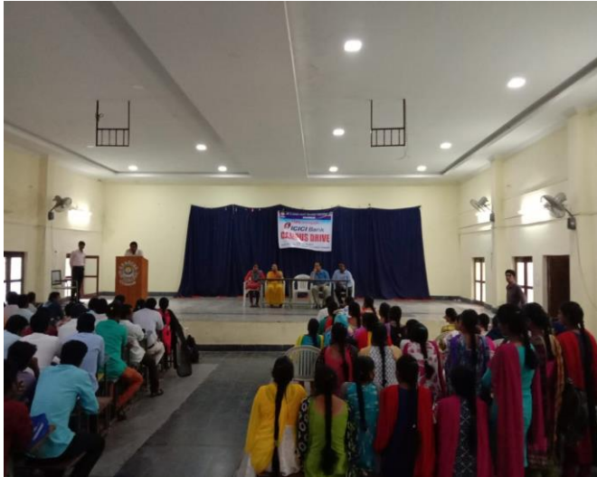
i. Principal speech about Drive