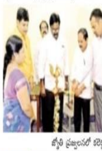
జిల్లా కలెక్టర్ ఆదర్శ కృష్ణ పేర్కొన్నారు.