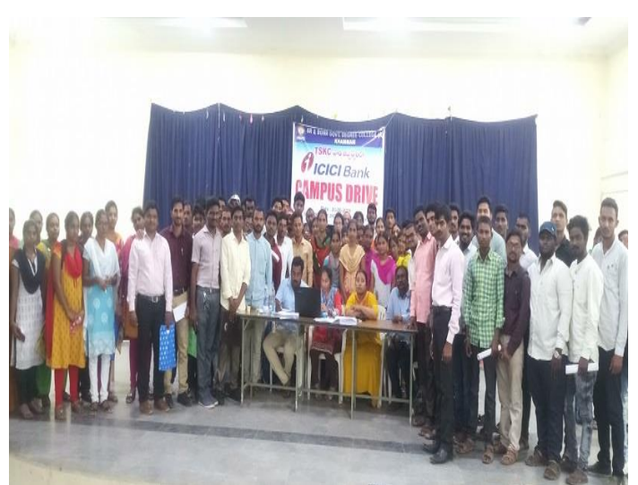
iv. Selected students.