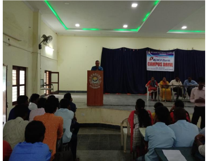
ii. Employment officer speech about Drive