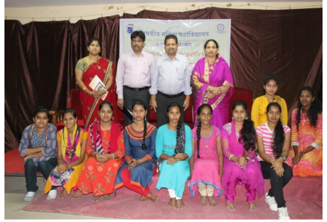
Hindi Extension Lecture