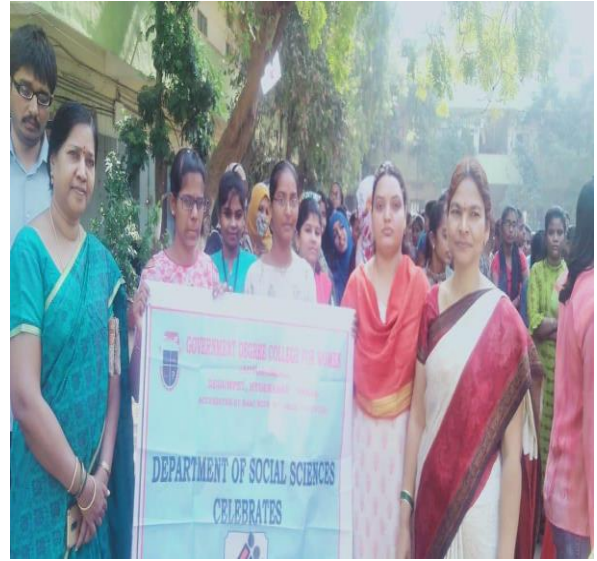
STUDENT TEACHER PROGRAMME