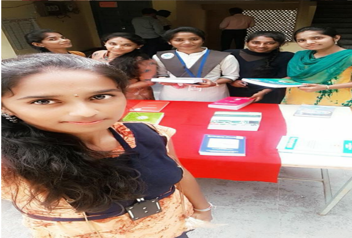
LIBRARY –“WEEK BOOK EXHIBITION” for the students on 15th November 2019