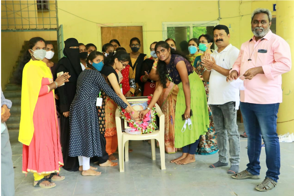
Celebration of librarian's day on 12 TH August 2020