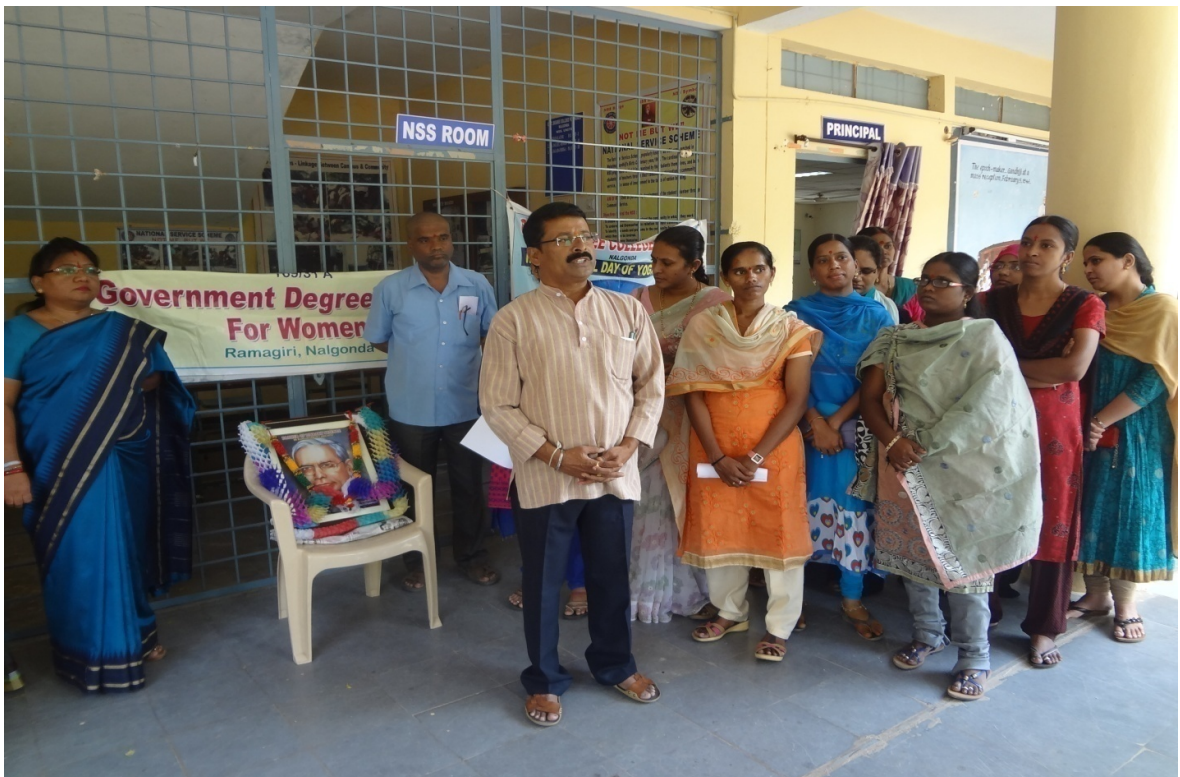
CELEBRATIONS OF LIBRARIAN'S DAY ON 12 TH AUGUST 2016