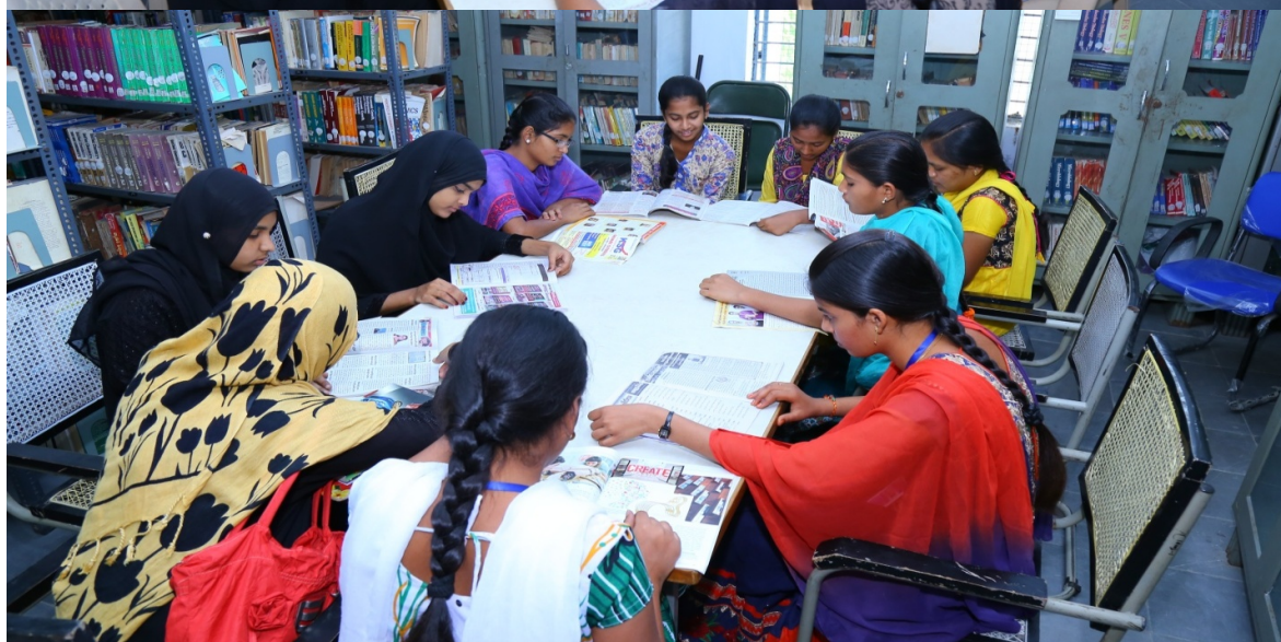
Students are reading news papers