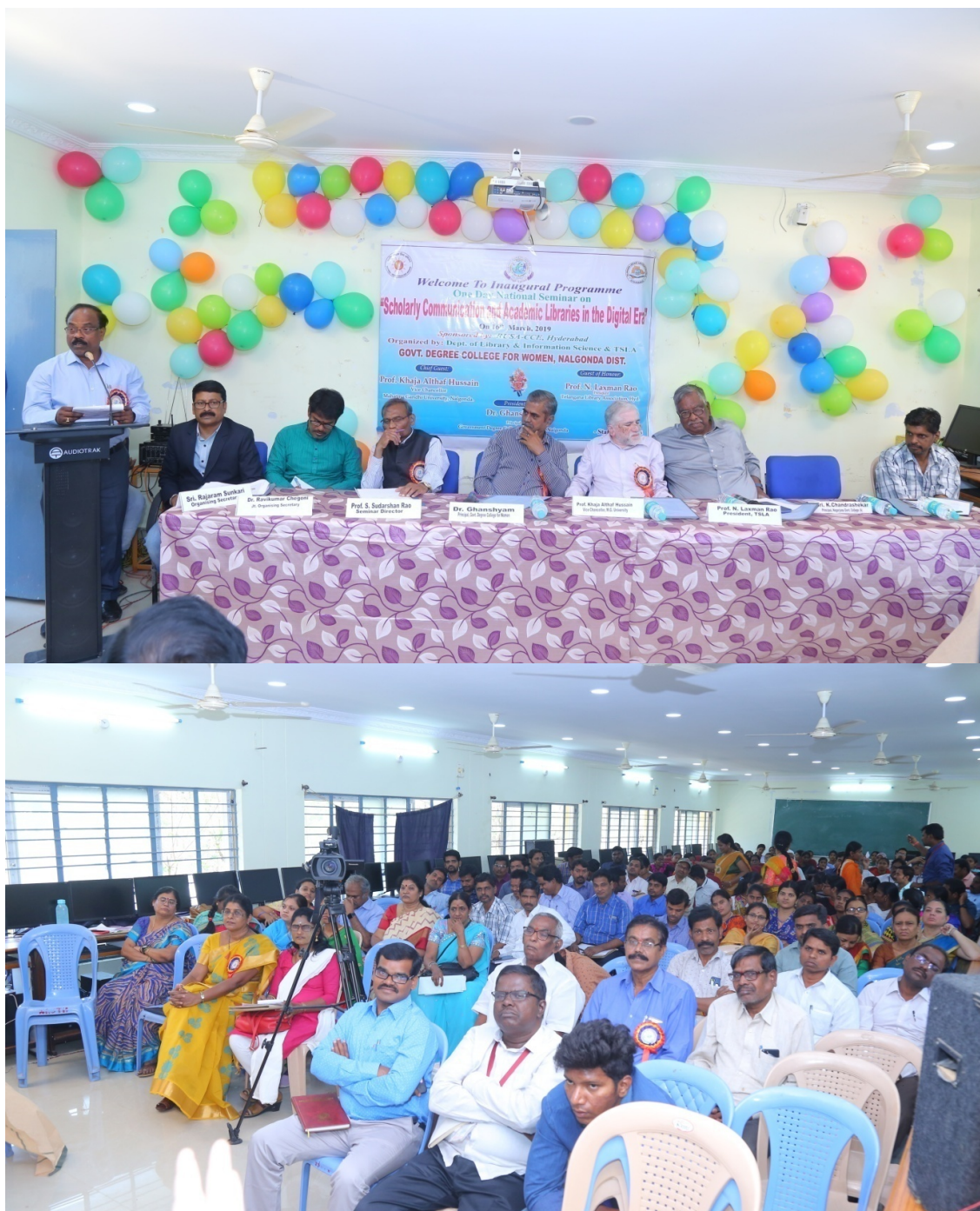
National Seminar on "Scholarly Communication and Academic Libraries in the Digital Era" conducted by Department of Library Science,GDCW,Nalgonda on 16 th March 2019.