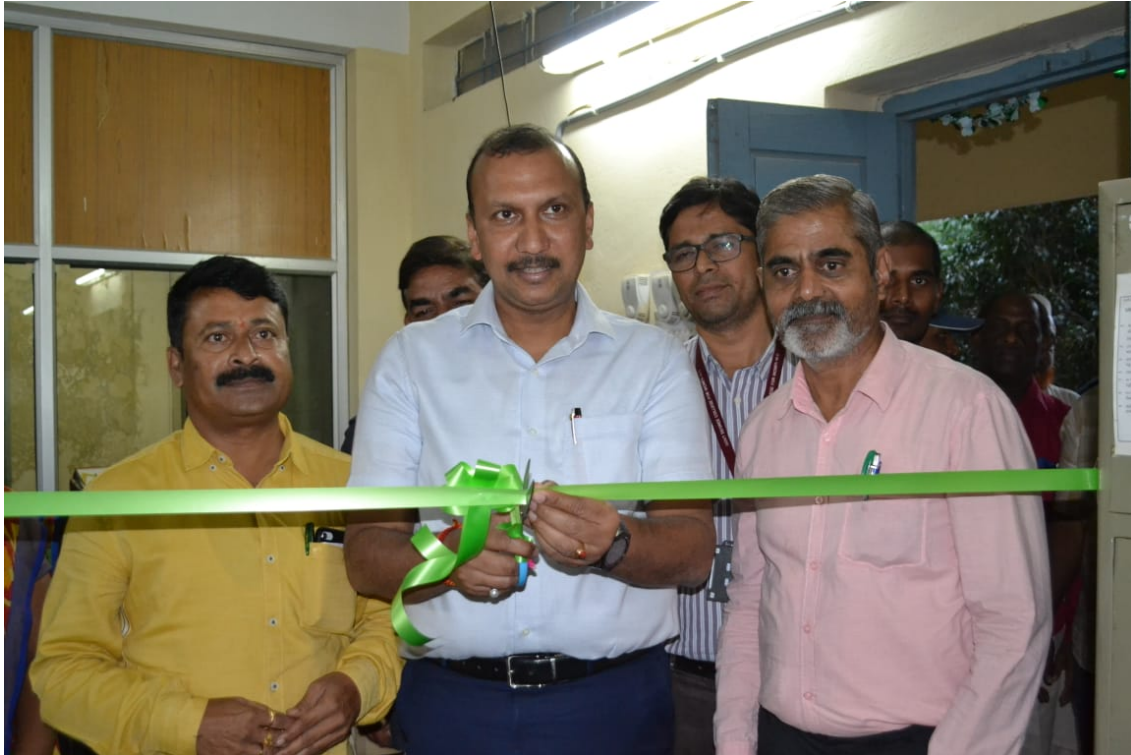
COLLEGE "DIGITAL LIBRARY" INUAGURATED BY COMMISSIONER, C.C.E. SRI. NAVIN MITTAL IAS