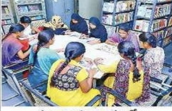
కళాశాల గ్రంథాలయంలో చదువుకుంటున్న విద్యార్థినులు

నల్గొండ టౌన్, స్కాన్ టౌడే: ఉమ్మడి నల్గొండ జిల్లాలో ఏకైక మహిళా డిగ్రీ కళాశాల నల్గొండ పట్టణంలోని రామగిరిలో ఉంది. తెలంగాణలో ఆ దర్జ కళాశాలగా పేరు తెచ్చుకున్న ఈ కళాశాల, ఆంధ్రప్రదేశ్ లో అతిపెద్దది. ఇక్కడ వివిధ