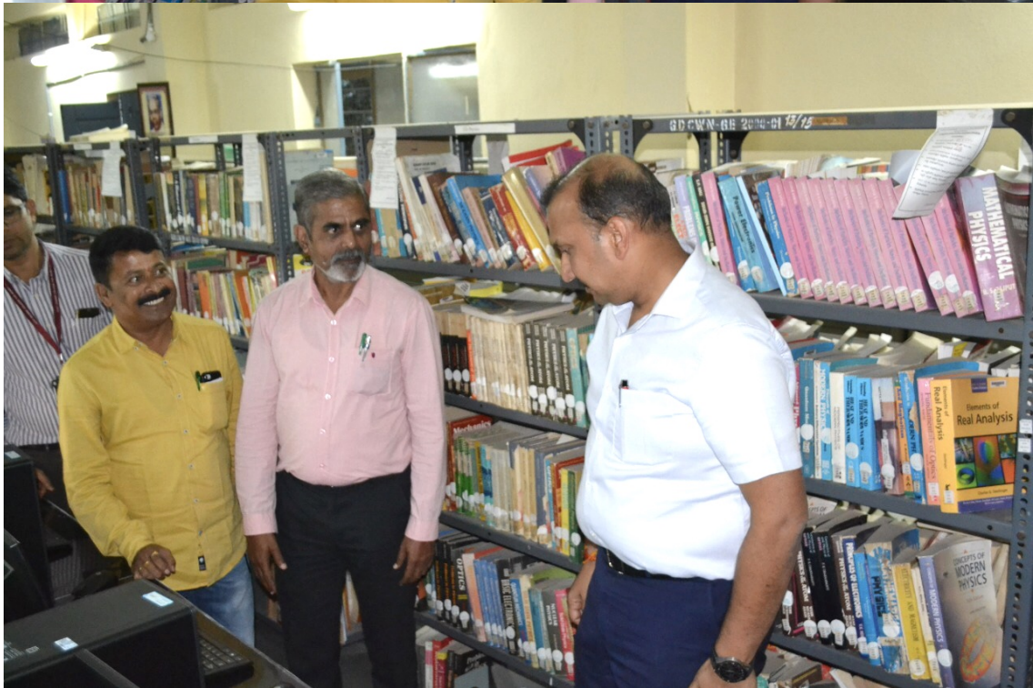
Watching digital library by Sri Naveen Mittal IAS, Commissioner,CCE.