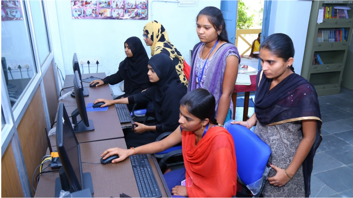
Utilization of Digital library by Students