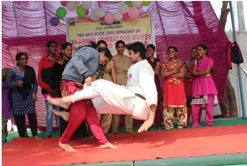
Instructor train the students in self – defence technique