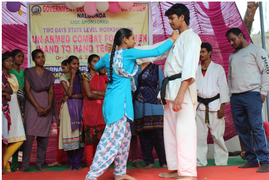
Instructor train the students in self – defence technique