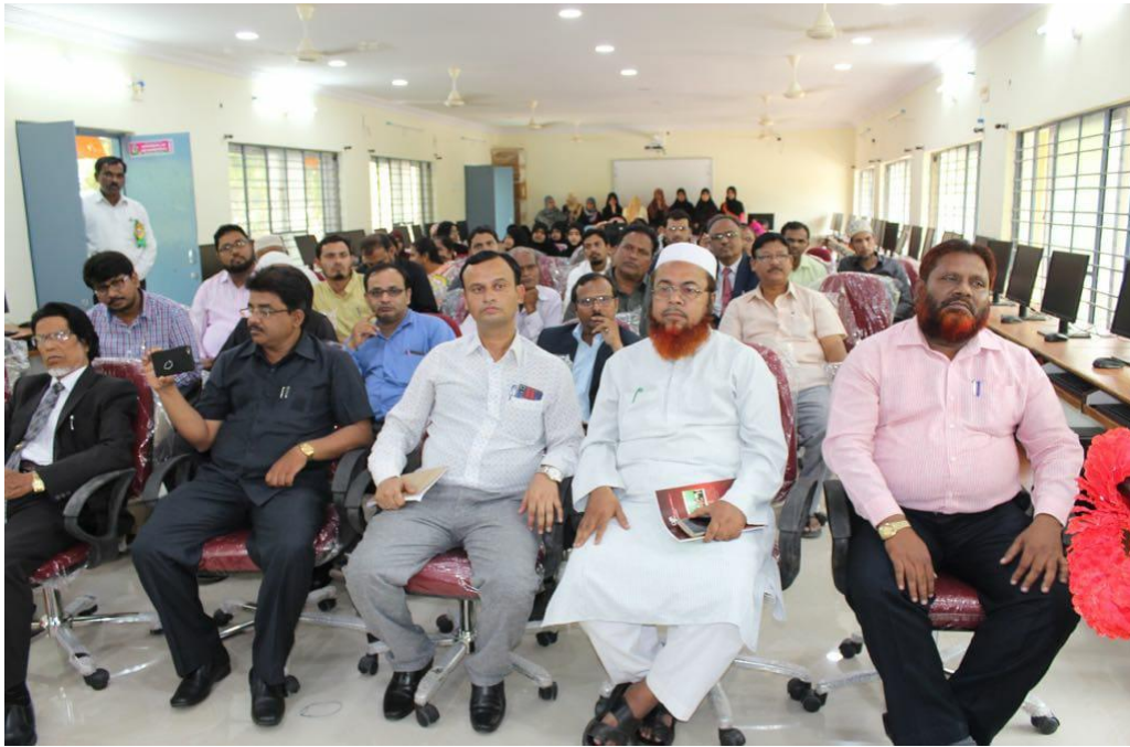
Participants who attended the seminar