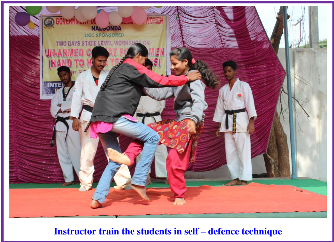
Instructor train the students in self – defence technique