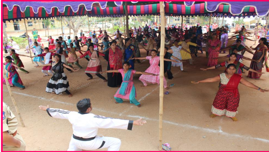
Instructor giving instructions to students & Students follow the instructions