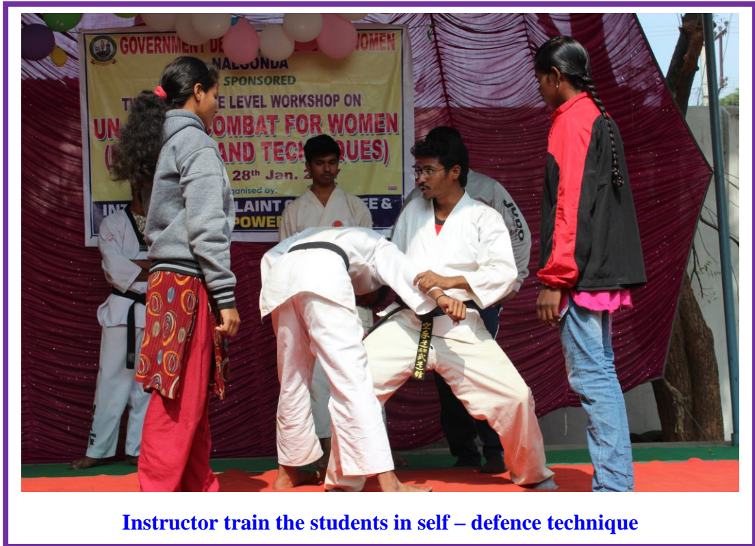
Instructor train the students in self – defence technique