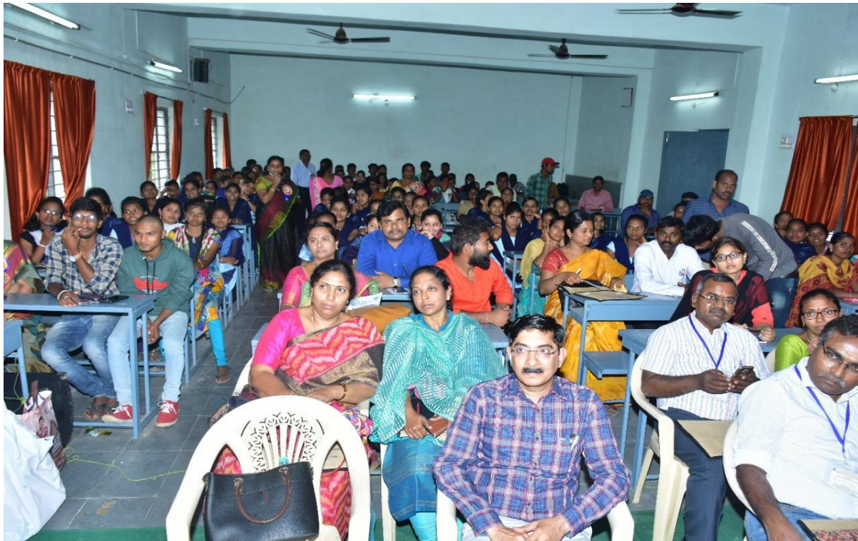
Participants from various colleges across India.