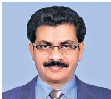
Prof K Purushotham

He also suggested that the whole semester system should be continuous per se,