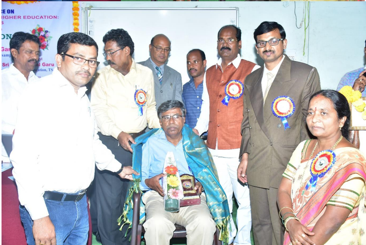
RUSA Sponsored One Day National Conference on "E-Content Development and OERs in Higher Education: Issues and Challenges" 31-01-2020