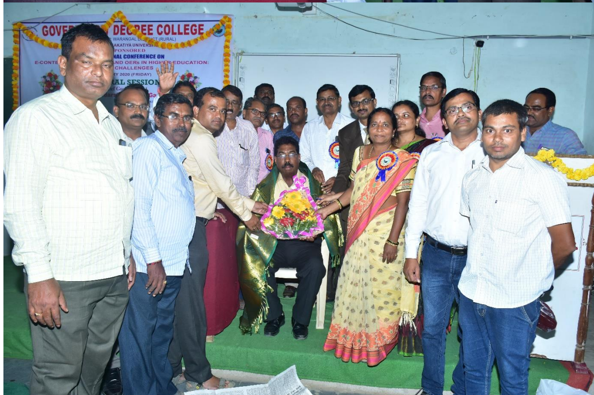
RUSA Sponsored One Day National Conference on "E-Content Development and OERs in Higher Education: Issues and Challenges" 31-01-2020