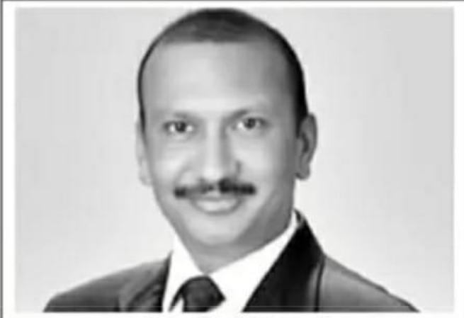
కమిషనర్ నవీన్ మిట్టల్

- హ్యూయర్ ఎడ్యూకేషన్ కమిషనర్ నవీన్ మిట్టల్